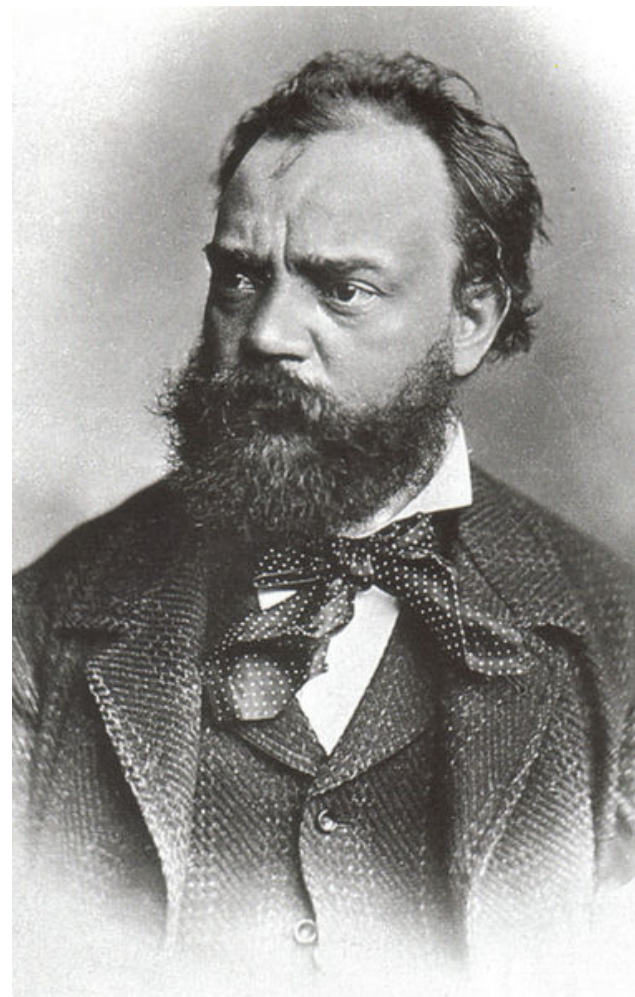
Antonín Dvořák 1841–1904

"... Mám tu čest Vám oznámiti, že jsem práci šťastně dokončil a že se z ní upřímně raduji. Myslím, že to bude dílo, které svému účelu plně vyhoví. Mohlo by se jmenovat: víra, naděje a láska k Bohu nejvyššímu a poděkování za tak veliký dar, že mně bylo popřáno dílo to ke chvále Nejvyššího a ke cti umění našeho šťastně dokončiti. Nedivte se, že jsem tak nábožný, ale umělec, který to není, nic takového nedokáže. Což nemáme příklady na Beethovenovi, Bachovi, Raffaelovi a mnoha jiných?"