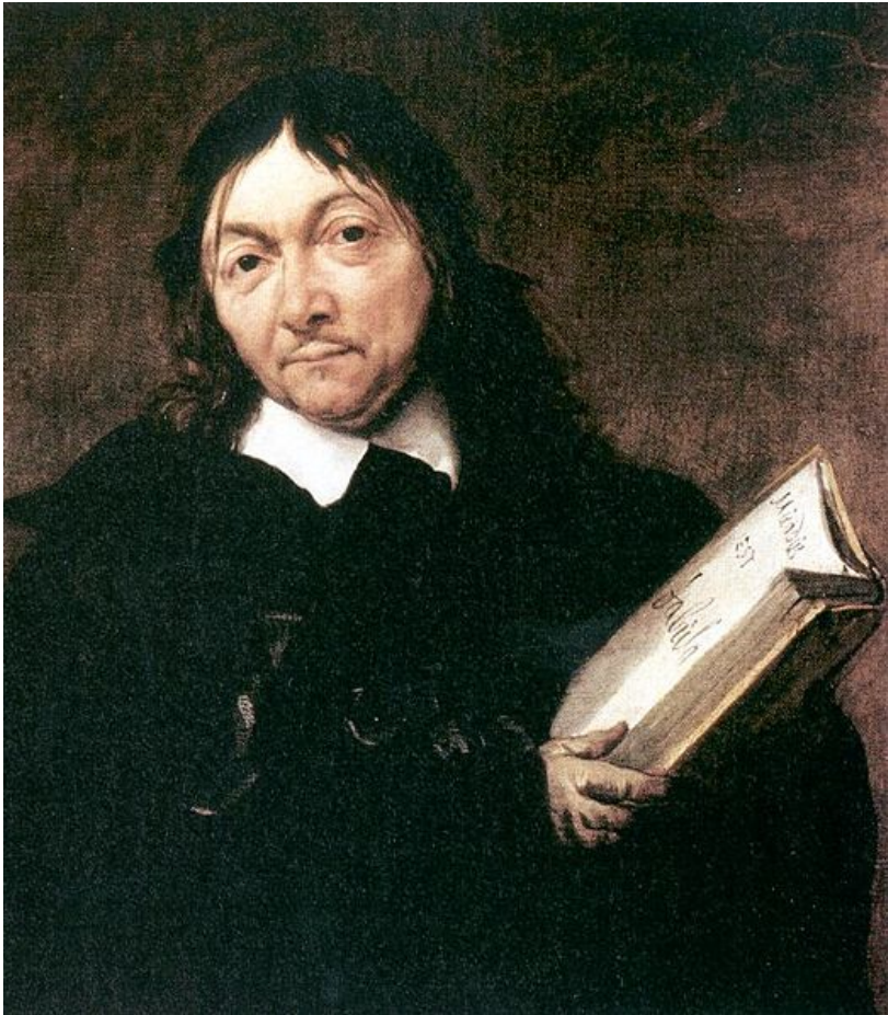
René Descartes (Cartesius)