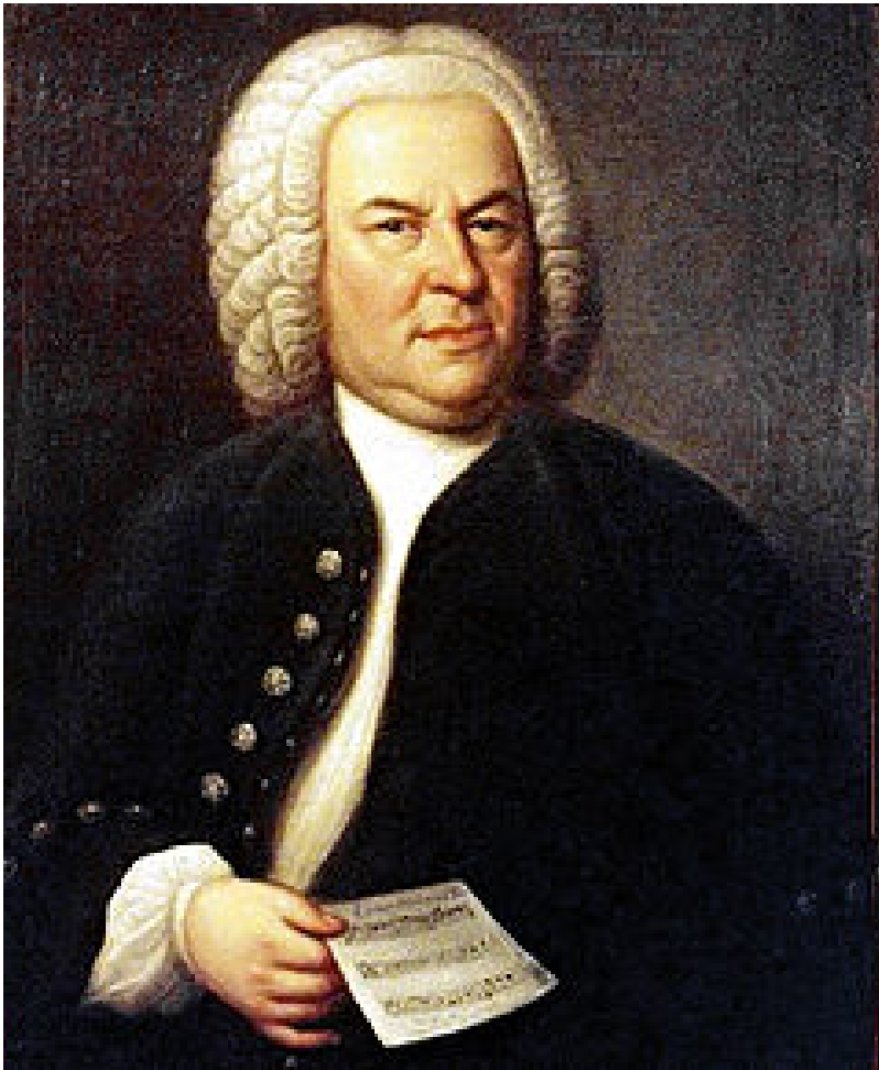
Johann Sebastian Bach 1685–1750

Ve svých hovorech o hlubokých věcech byl vždy velmi zdrženlivý, nevyjadřoval se vůbec slovy, která mluvil, nýbrž tím, čím byl, a především ovšem svou hudbou. Byl nejnáboženštějším člověkem, jehož jsem v životě poznala.