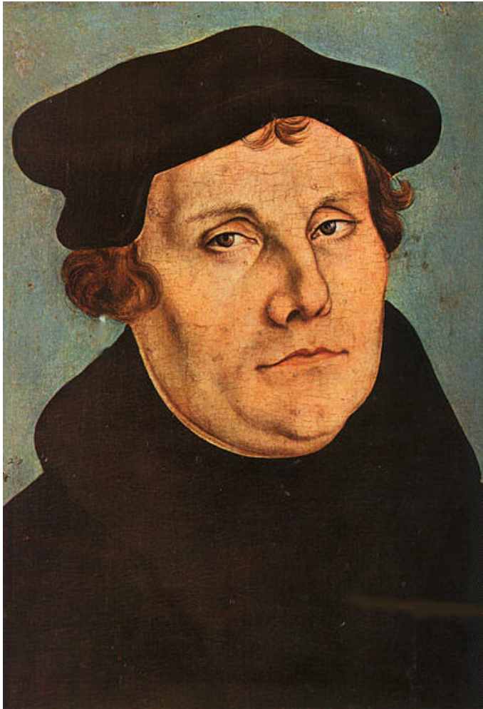
Martin Luther 1483–1546

„Hudba je jedním z nejkrásnějších a nejnádhernějších darů Božích. Je jedním z nejlepších umění. Noty oživují slova. Hudba zahání duchu smutek, jako bychom se dívali na krále Saula. Je nejlepší útěchou pro zarmoucené lidi, jí se srdce uspokojí, občerství a osvěží.“