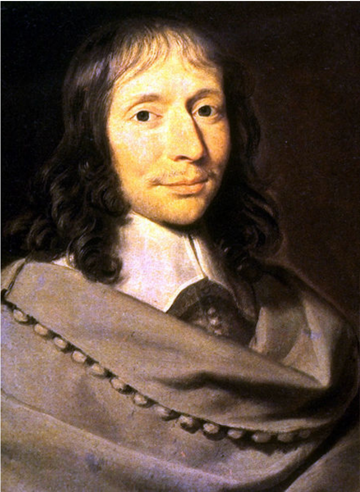
Blaise Pascal 1623 - 1662