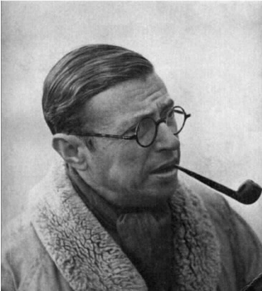
Jean Paul Sartre