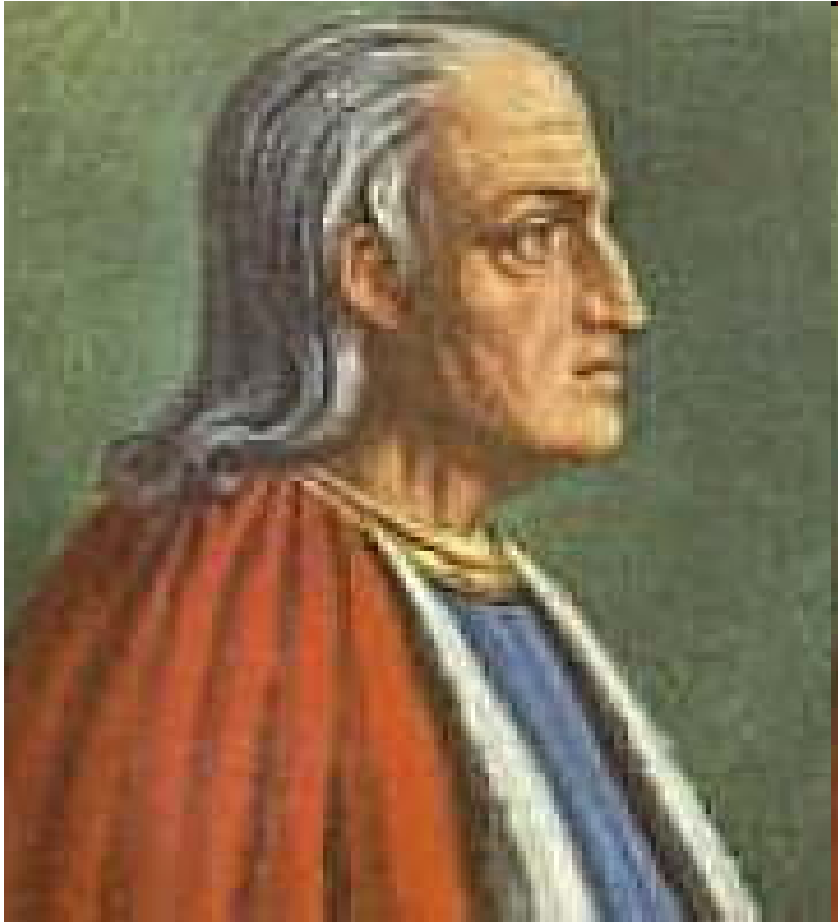
Anselm z Canterbury