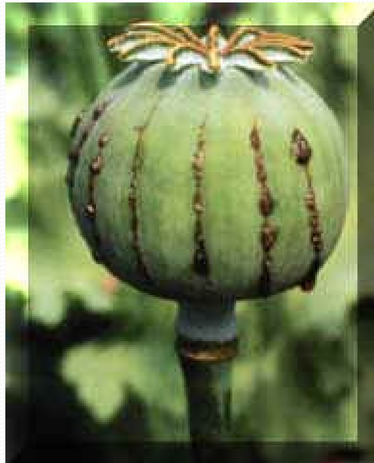
Obr. 1. makovice