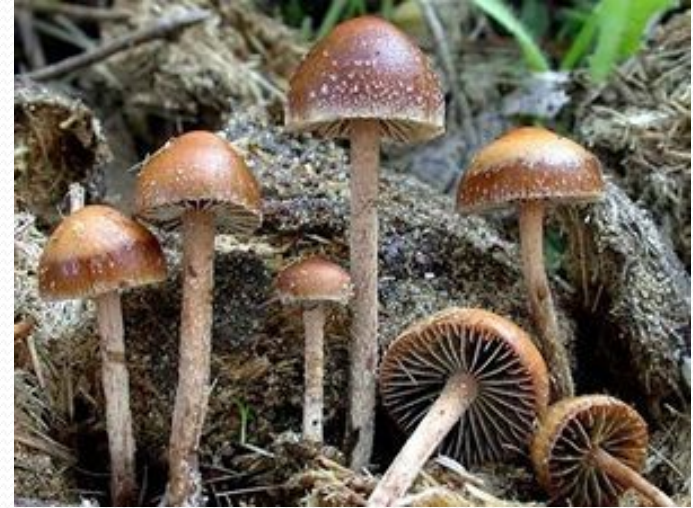
Obr. 8. Lysohlávky