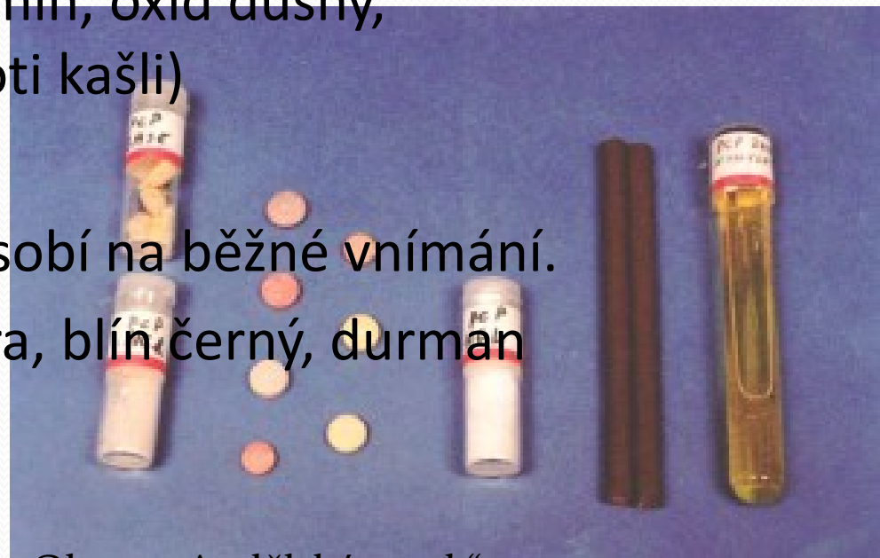
Obr. 9 „Andělský prach“