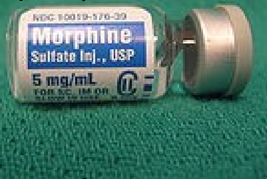
Obr. 2. morphine