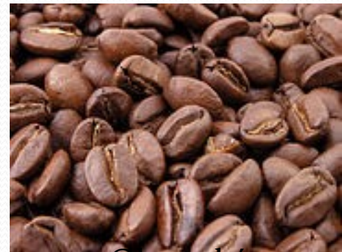
Obr. 7. káva