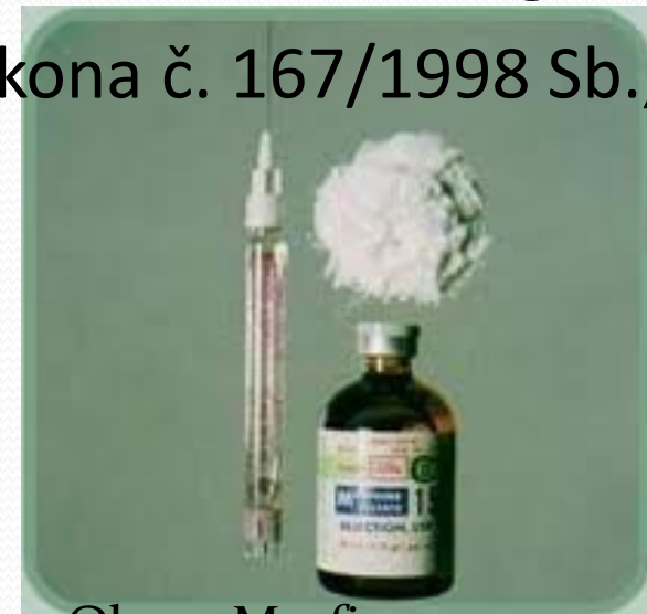
Obr. 3. Morfin