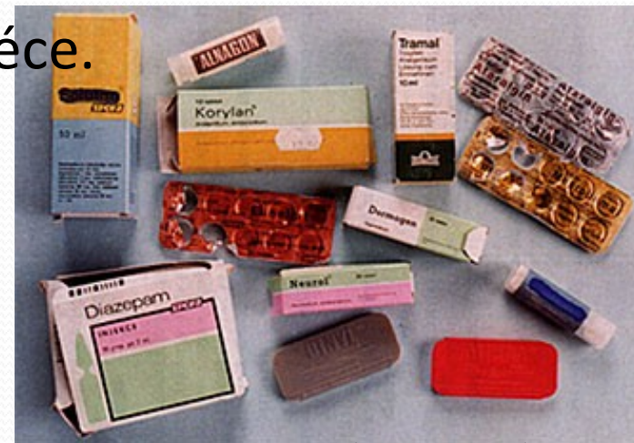
Obr. 10 sedativa