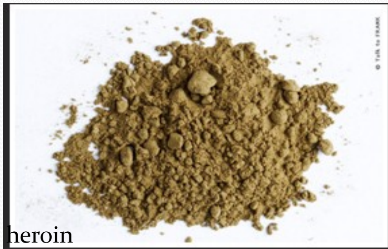
Obr. 4. heroin