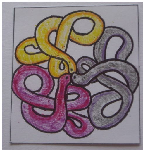
chemie – hadi