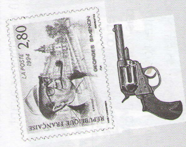
G. Simenon, Maigret se fâche , Presses de la Cité.

ait sept heures du soir. Il faisait l et il pleuvait. Il y avait peu de sants dans la rue. Un homme nge habillé en noir rôdait autour ôtiment. Il avait l'air mystérieux. Je parlais au concierge quand il entré [...]. Quelques minutes es j'ai entendu un coup de fusil. is sommes montés au premier e. La lampe éclairait mal. Le cou- était sombre. [...] Nous ne ons que faire [...].