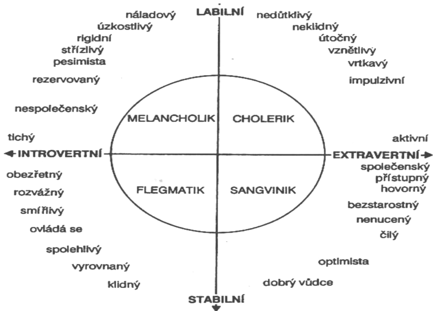
Obr. 12 Schéma vlastností a typů temperamentu podle Eysencka (Balcar, K.: Úvod do studia psychologie osobnosti. Praha, SPN 1983, s. 97).