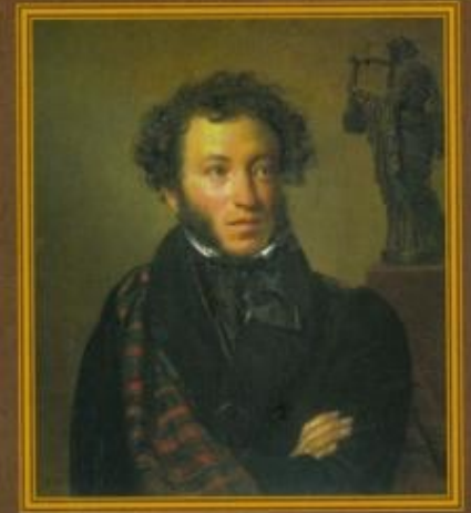
Александр Сергеевич Пушкин Alexandr Sergejevič Puškin