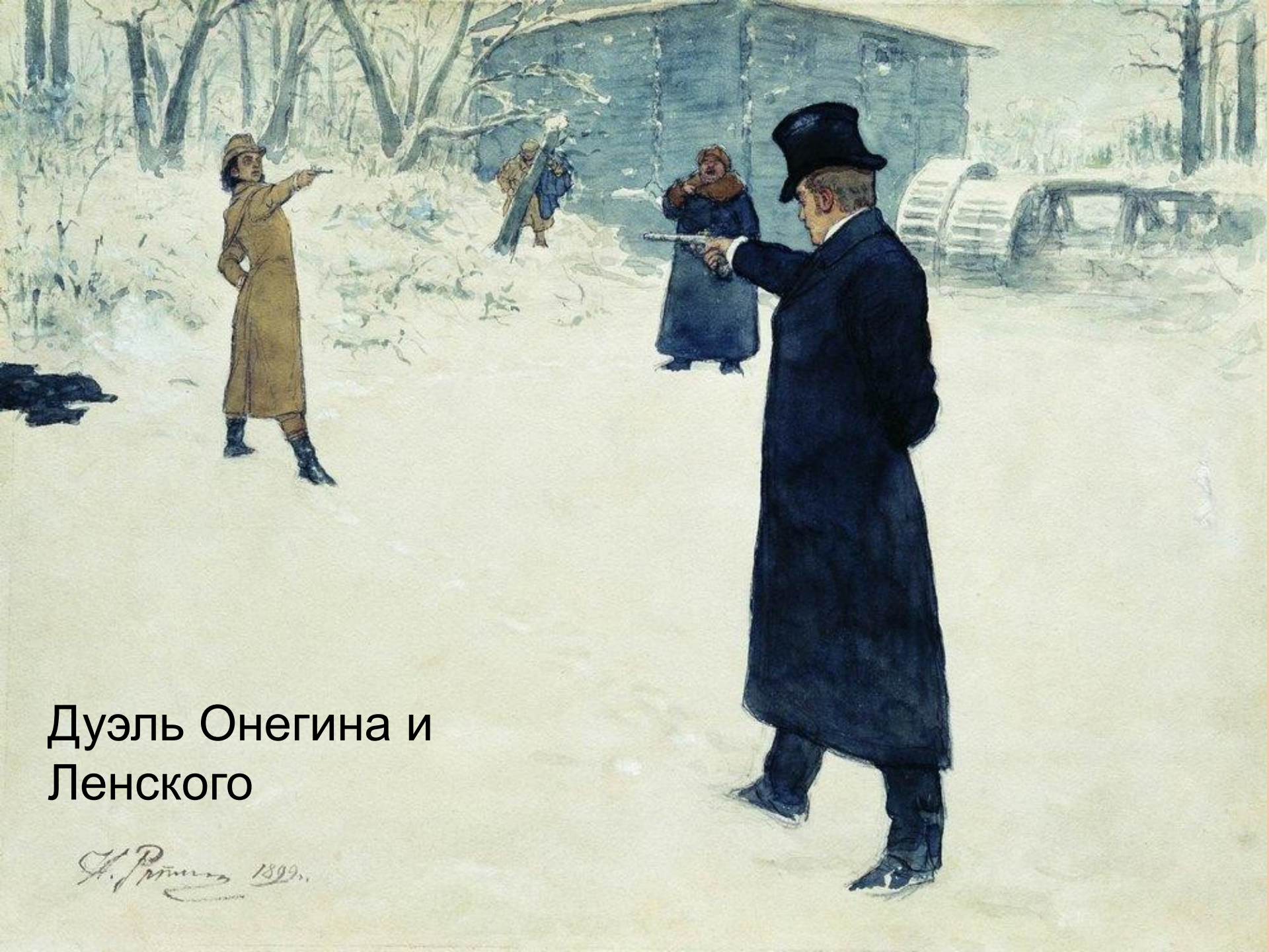
Дуэль Онегина и Ленского