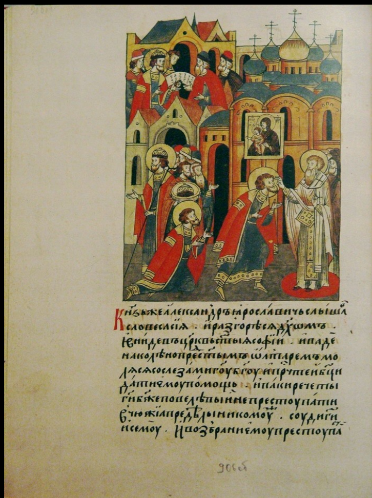
Житие св. Александра Невского в составе Лицевого летописного свода XVI века