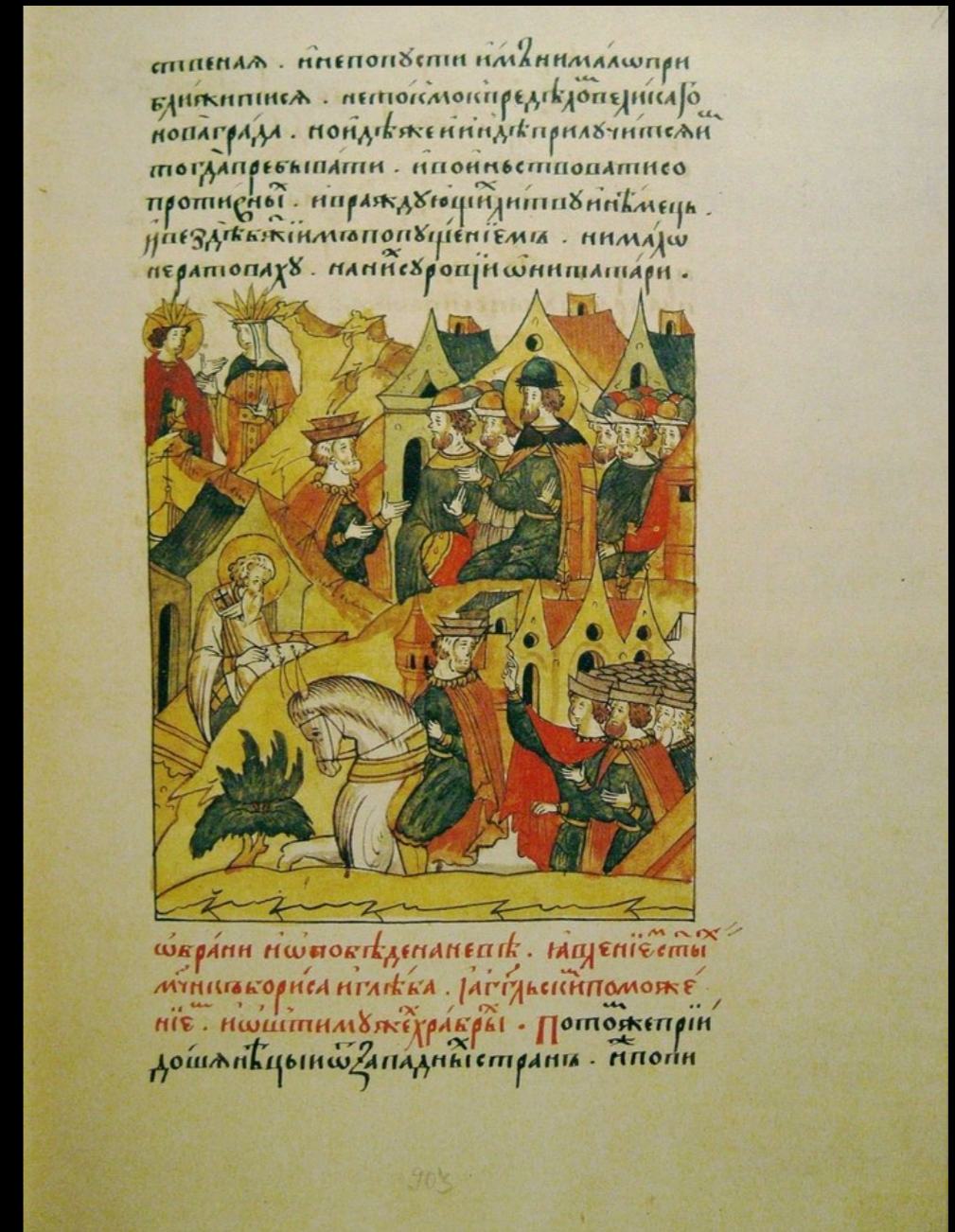
Житие св. Александра Невского в составе Лицевого летописного свода XVI века