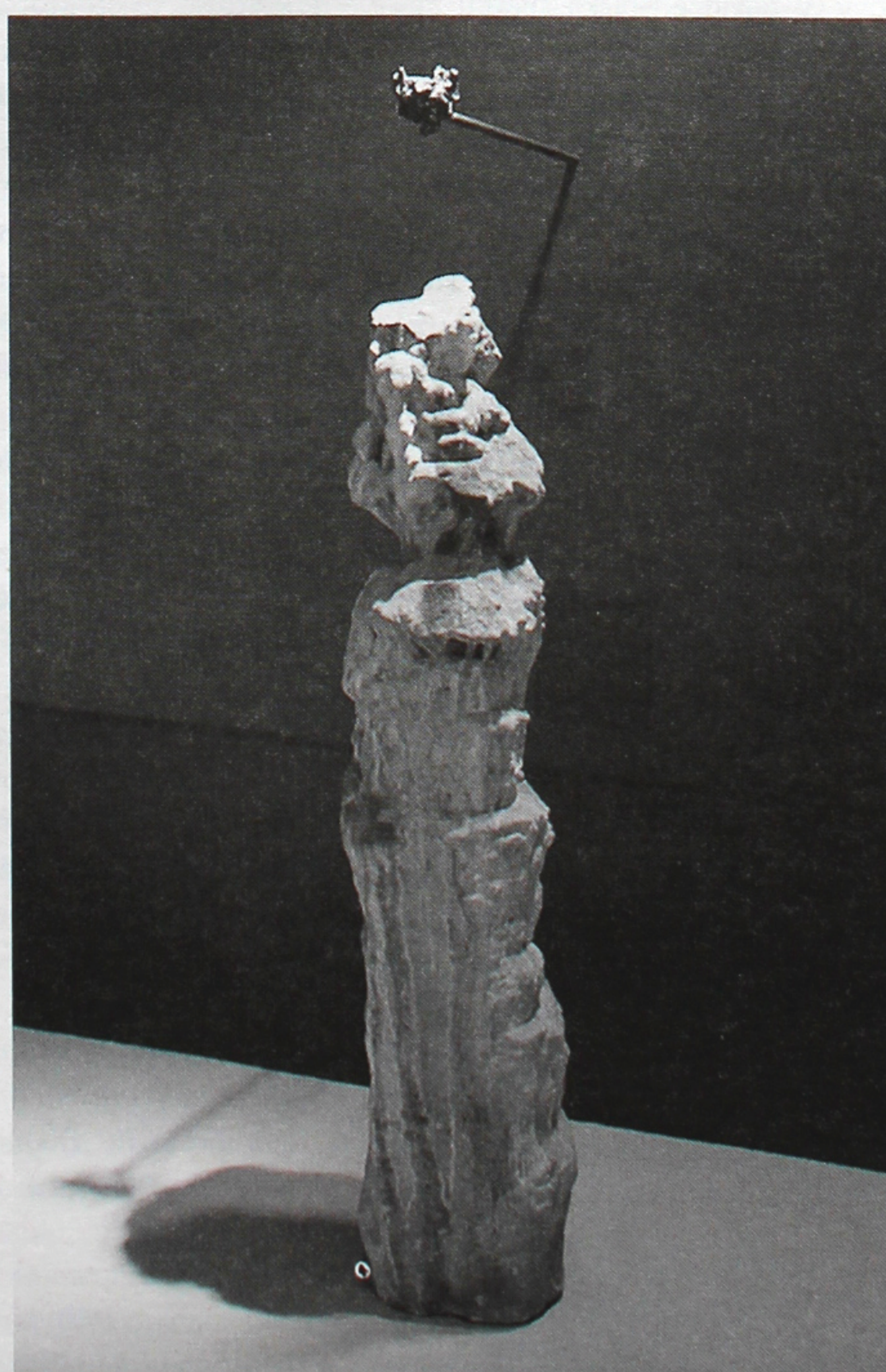
Pavel Sterc, Dva malé průsečky na velké vertikále, 2011.