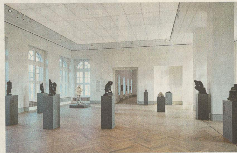
Klasikové moderny. Detail Munchova obrazu a pohled do sálu s Rodinovými sochami.

Každý z výstavních sálů prezentuje jedno z témat, která do daného časového období spadají. Jeden sál srovnává expresionistu Emila Noldeho s impresionistou Maxem Liebermannem, další Rodina s Monetem, jiný představuje abstrakci po Kandinském a abstrakci ve Spojených státech... Nic, co by návštěvníka mělo obzvláště překvapit. Vzhledem k tomu, že výstava časově překlenuje více než půl století uměleckého kvasu a kromě Evropy zabrousí i do amerického prostředí, výsledkem je povrchnost.