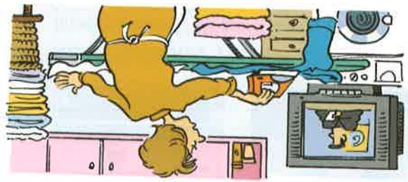
Während sie bügelt, sieht sie fern.

b) Was kann man gleichzeitig tun? Schreiben Sie drei Sätze wie in den Beispielen.