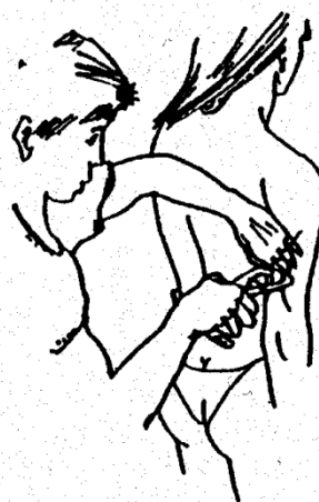
Obr. 35A. Kožní řasa nad tricepsem