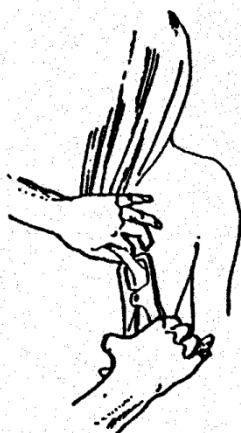
Obr. 35B. Kožní řasa nad lopatkou