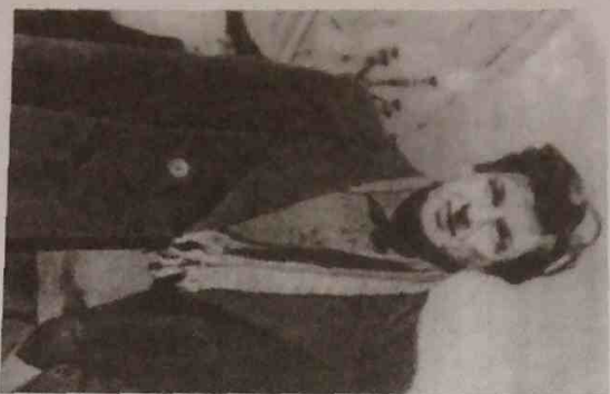
Ю. О. Домбровский

На это время приходятся поэтические дефеты А. Вознесенского, Е. Евтушенко, Р. Рождественского, В. Ахмадулиной. В 1960-е годы выступления этих поэтов собирали стотысячные аудитории — целые стадионы. Они стали голосами эпохи «оттепели», так же как поэтическими голосами семидесятых и восьмидесятых, только неразрешенными, ставшими возможными благодаря тому, что поэт имел возможность познакомиться также со стихами Н. Рубцова, А. Тарковского, Д. Самойлова, Л. Марьянова и других.