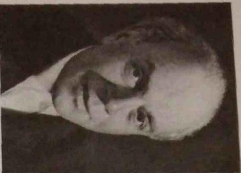
Д. С. Самойлов

Особенности литературы 1960-х годов оказались тесно связанными с ослаблением идеологических запретов и отменной табу на целый ряд тем. Появилась возможность говорить о сталинских лагерях, о коллективизации и голоде в деревне, об уничтожении крестьянства. В журнале «Новый мир» были опубликованы повесть А. И. Солженицына «Один день Ивана Денисовича» (1962) и рассказ «Матренин двор» (1963). В этот период, хотя и не в полном объеме, публикуются «запрещенные» произведения М. Булгакова, М. Цветаевой, А. Платонова, М. Зощенко, что было невозможным, начиная с 1930-х годов.