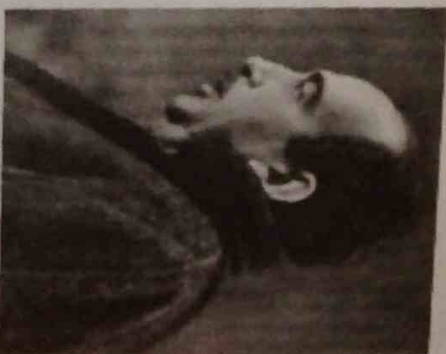
А. А. Галич

В 1950–1980-х годах значительная часть людей ничего не знала ни об истинной картине жизни России до 1917 года, ни о реальной жизни в современных европейских и американских, ни о фактах советской истории. Подавление крестьянских и казачьих восстаний 1918–1922 годов; организованный властью террор в Поволжье и на Украине; массовое истребление людей в период коллективизации сельского хозяйства; массовые аресты 1930–1950-х годов; ложное обвинение в государственной измене и аресты сотен тысяч советских солдат и офицеров, пропавших немецкий плен, в том числе и ла-