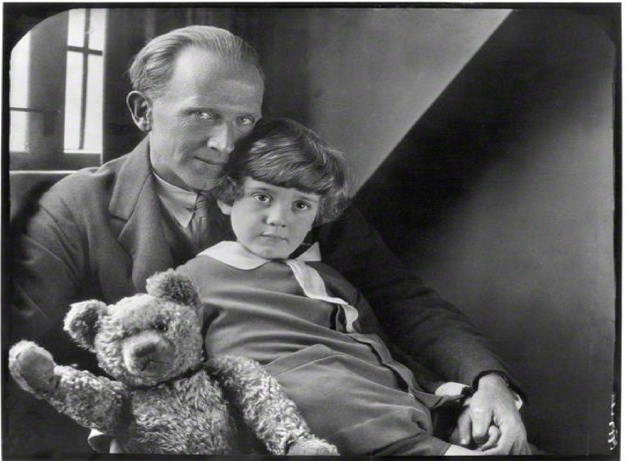
A. A. Milne and Christopher Robin Milne 1926