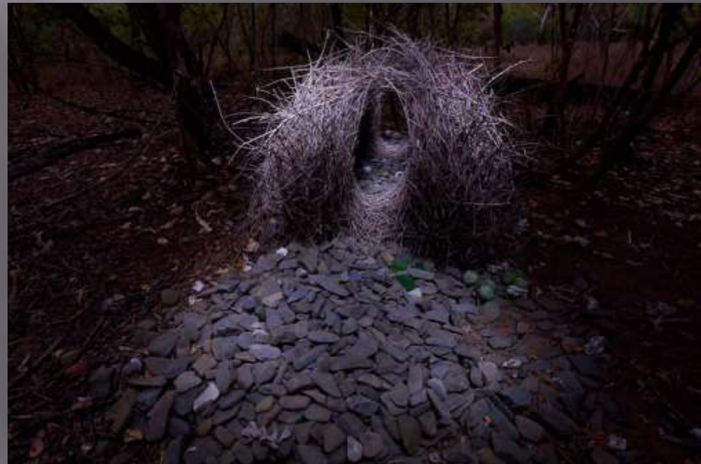
lemčík velký ( Chlamydera nuchalis )