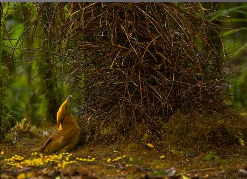
lemčik zlatočelý ( Amblyornis flavifrons )