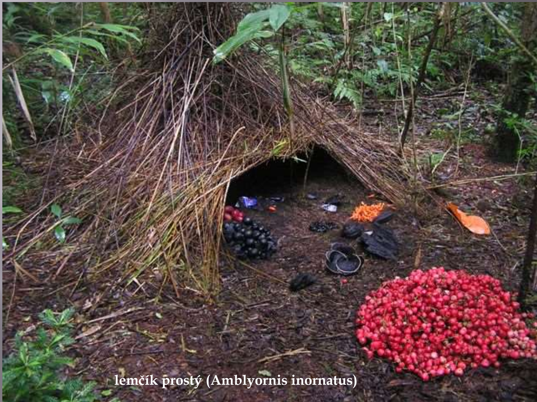
lemčik prostý ( Amblyornis inornatus )