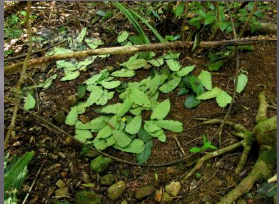
lemčík tlustozobý ( Ailuroedus crassirostris ) lemčík zejkozobý ( Ailuroedus dentiostrius )