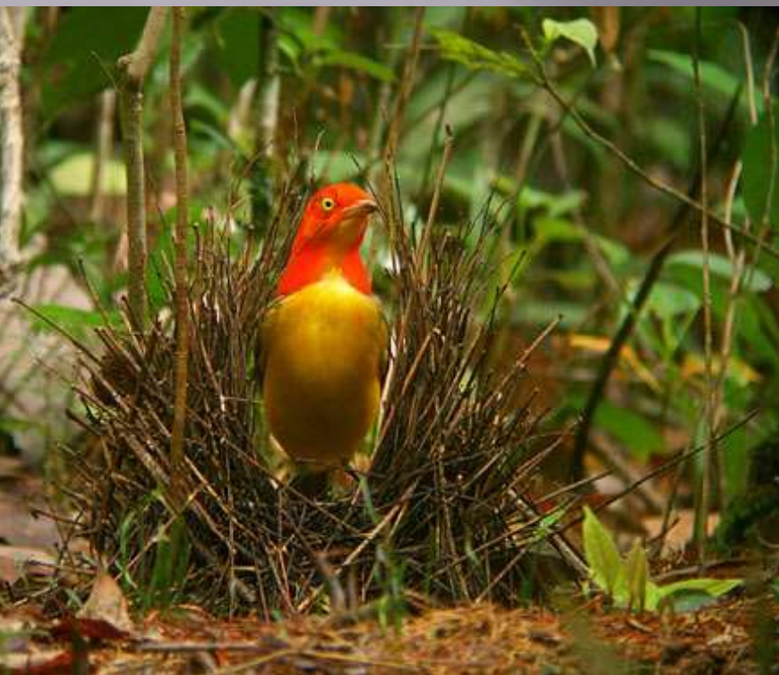
lemčik hřívnatý ( Sericulus bakeri )