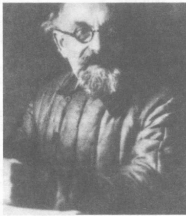
М. М. Пришвин. 1930-е гг.