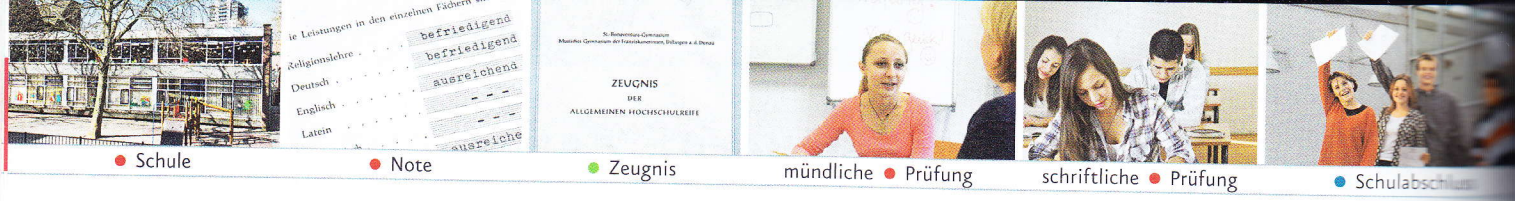
● Schule ● Note ● Zeugnis mündliche ● Prüfung schriftliche ● Prüfung ● Schulabschluss