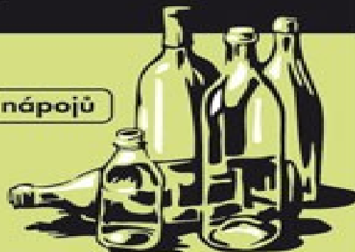
Láhve od nápojů