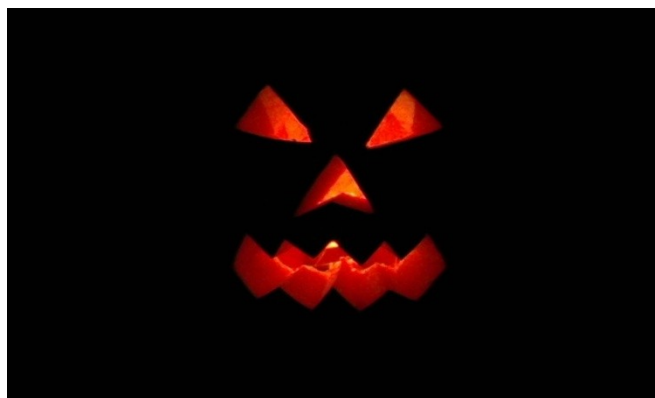
6. Žáci spolu s učitelem zapálí v dýni svíčku.