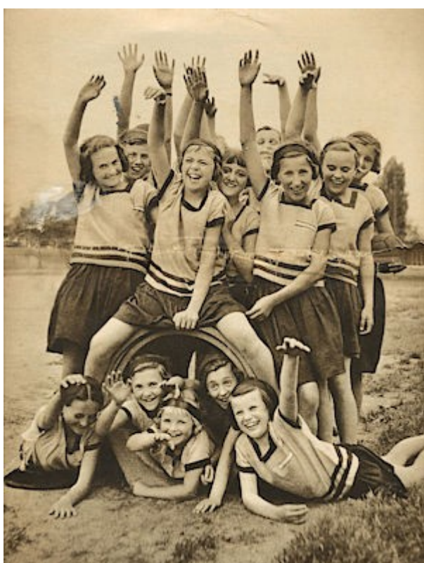
Sokolské žačky v září 1938 na obálce Pestrého týdne