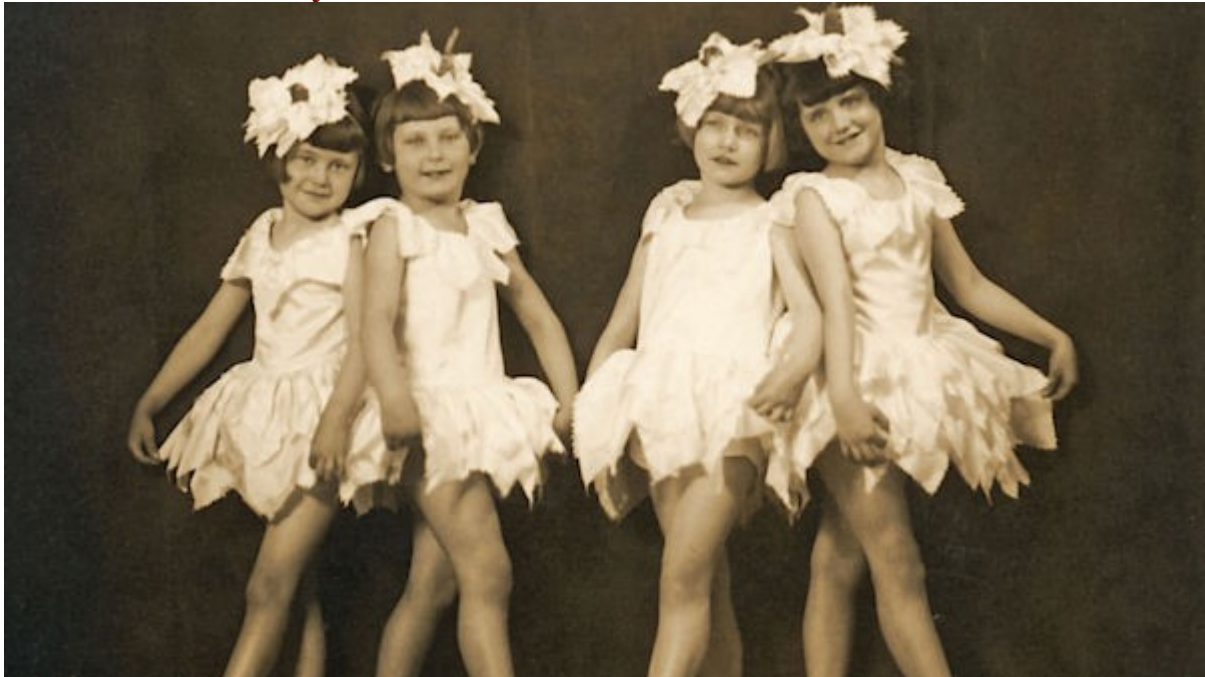
Dívky v baletní škole v roce 1933

Mezinárodní den dětí se slaví teprve od roku 1949 a veřejný zájem o nejmladší pokolení je jen o něco staršího data. Až s nástupem moderní doby se začalo o dětech psát v tisku, navrhovat pro ně oblečení nebo nábytek.