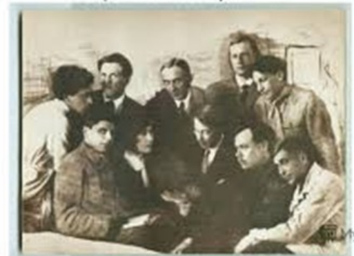
Михаил Зощенко на собрании литературного кружка «Серрапионовы братья».