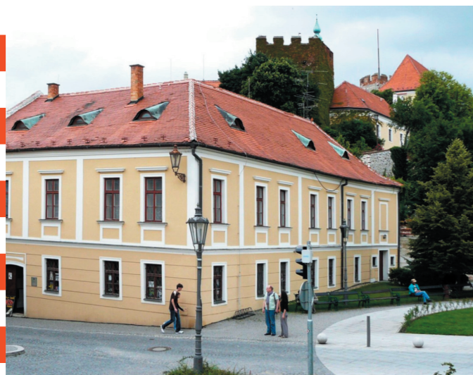
Lormův rodný dům na Brněnské ulici č. 9 v Mikulově. Lorms Geburtshaus in Mikulov, Brünnerstraße 9.

Im Jahre 2011 jährt sich der 190. Geburtstag des weltbekannten Nikolsburger Landsmannes, Hieronymus Lorm, Philosophen und Schriftstellers, Erfinder der Handtastsprache für Mitbürger, die weder sprechen noch sehen können. Sein Verdienst für die Menschheit führten den Museumsverein in Mikulov zum Entschluss, Lorms Werk entsprechend zu würdigen und eine Gedenktafel mit seinem Porträt zu installieren. Die feierliche Enthüllung findet am 23. 6. 2011 statt.