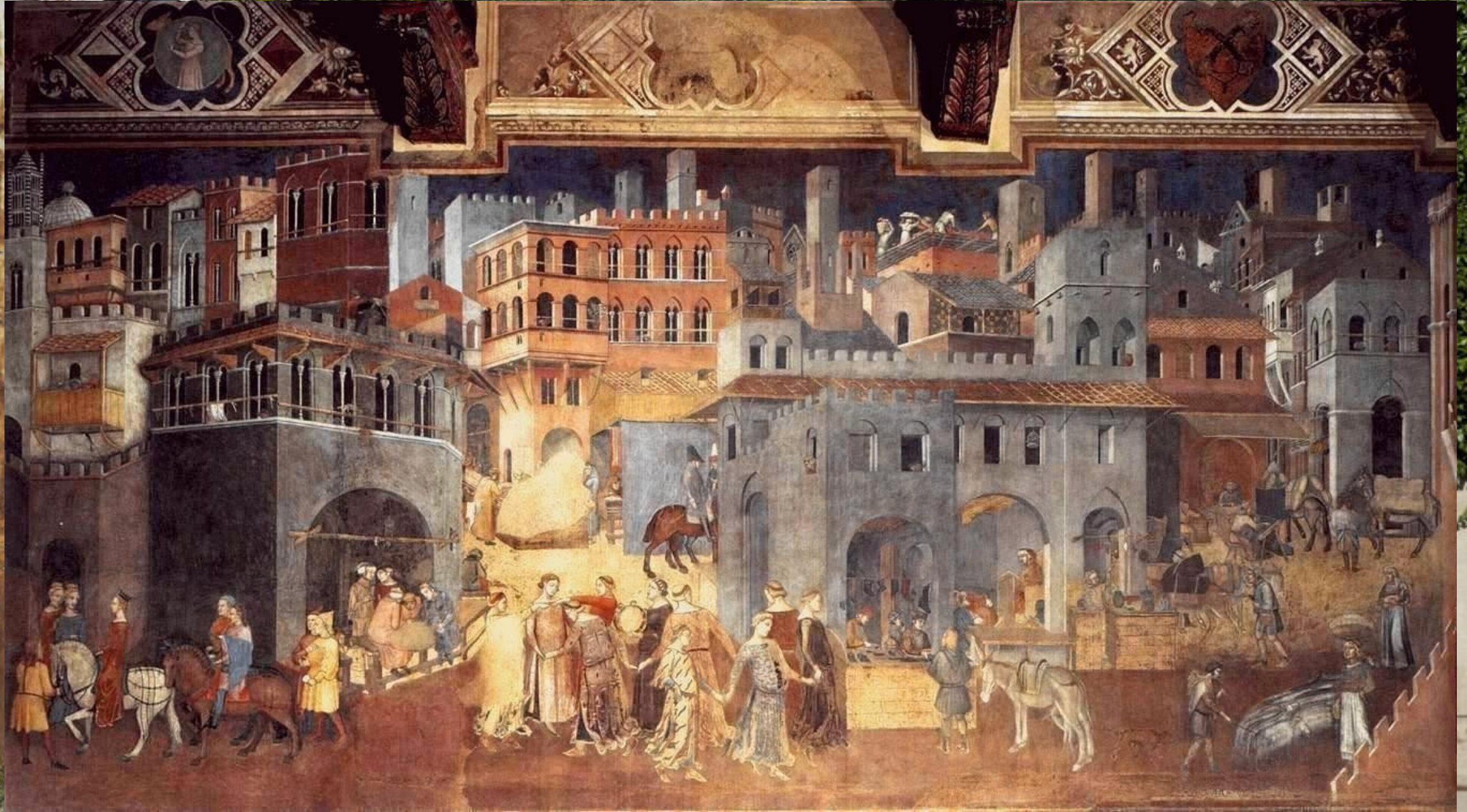
Ambrogio Lorenzetti - Důsledky dobré vlády (1348)