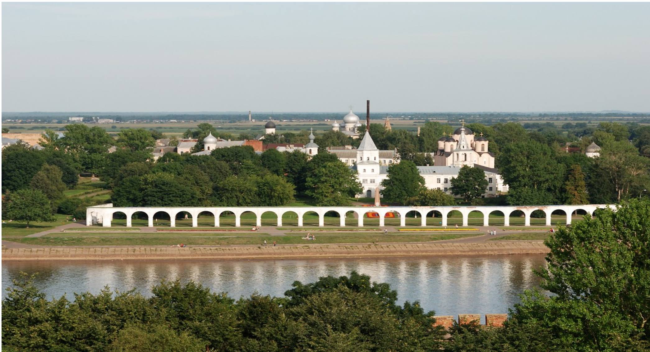
Ярославово Дворище – одно из мест вечевых собраний