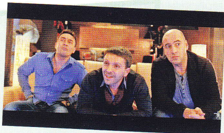
кадр из фильма «О чём ещё говорят мужчины» záběr z filmu „O čem ještě mluví muži“