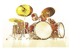
ударные музыкальные инструменты bicí hudební nástroje