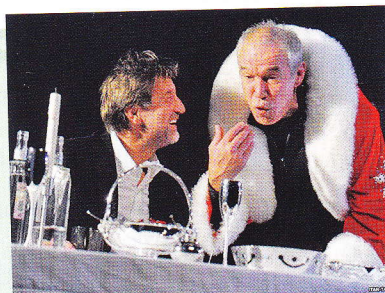
сцена из спектакля «С наступающим!», театр «Современник», Москва scéna ze hry „Šťastný a veselý!“, divadlo „Sovremennik“, Moskva