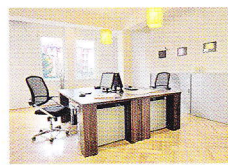
агентство agentura, kancelář