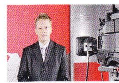
телеведущий televizní moderátor