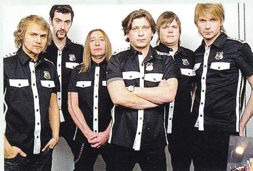
рок-группа Би-2 rocková kapela Bi-2