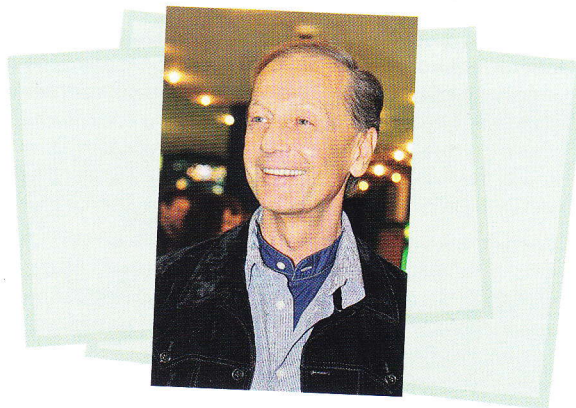
Михаил За́дорнов росси́йский писа́тель-сати́рик

«Думаю, количество глупостей в мире в целом есть величина неизменная. Её не становится больше, просто она прихорашивается и становится заметнее» «У нас сохранились люди, для которых совестью остались поэты и писатели, а не юристы и не политики»