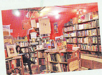
книжный магазин knihkupectví