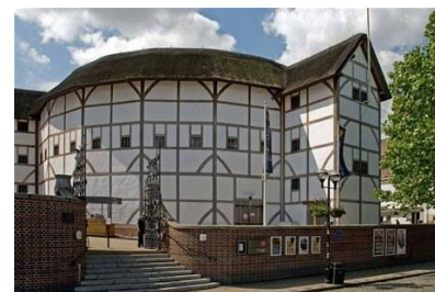
Divadlo Globe v Londýně

Když roku 1613 divadlo Globe vyhořelo, přesunula se společnost do divadla Blackfriars. Shakespeare ovšem přestal psát a vrátil se za manželkou a dcerami do svého rodiště, kde zůstal až do své smrti. Shakespeare zemřel 23. 4. 1616, v den svých narozenin.