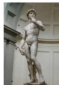
David od _____