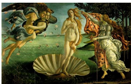
Zrození Venuše od _____