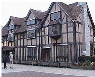
Rodný dům ve Stratfordu nad Avonou

William Shakespeara je považován za největšího dramatika světové literatury. Narodil se roku 1564 v Anglii ve Stratfordu nad Avonou. Jeho otec pracoval zřejmě jako rukavičkář a jeho matka Mary pocházela ze staré zemanské rodiny. Ve svém rodném městě vystudoval gymnázium. V 18 letech se oženil o osm let starší ženou Annou Hathawayovou, která již tou dobou čekala dítě. Sussana se narodila půl roku po svatbě. Později měli ještě dvojčata Judithu a Hamneta. Hamnet v 11 letech zemřel, což jistě poznamenalo Shakespeareovu tvorbu.