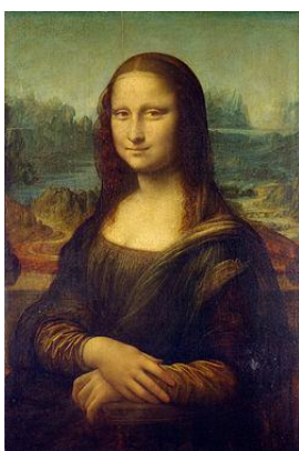
Mona Lisa od _____