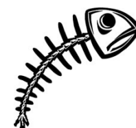
ohlodaná (okousaná) rybí