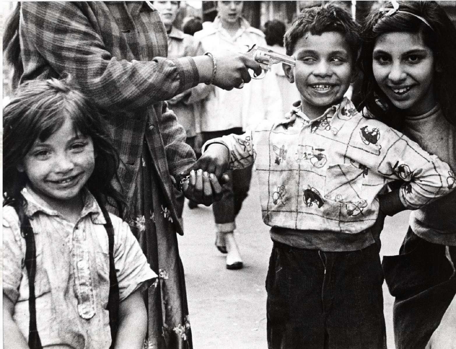
William Klein – Gun 2 (1955)