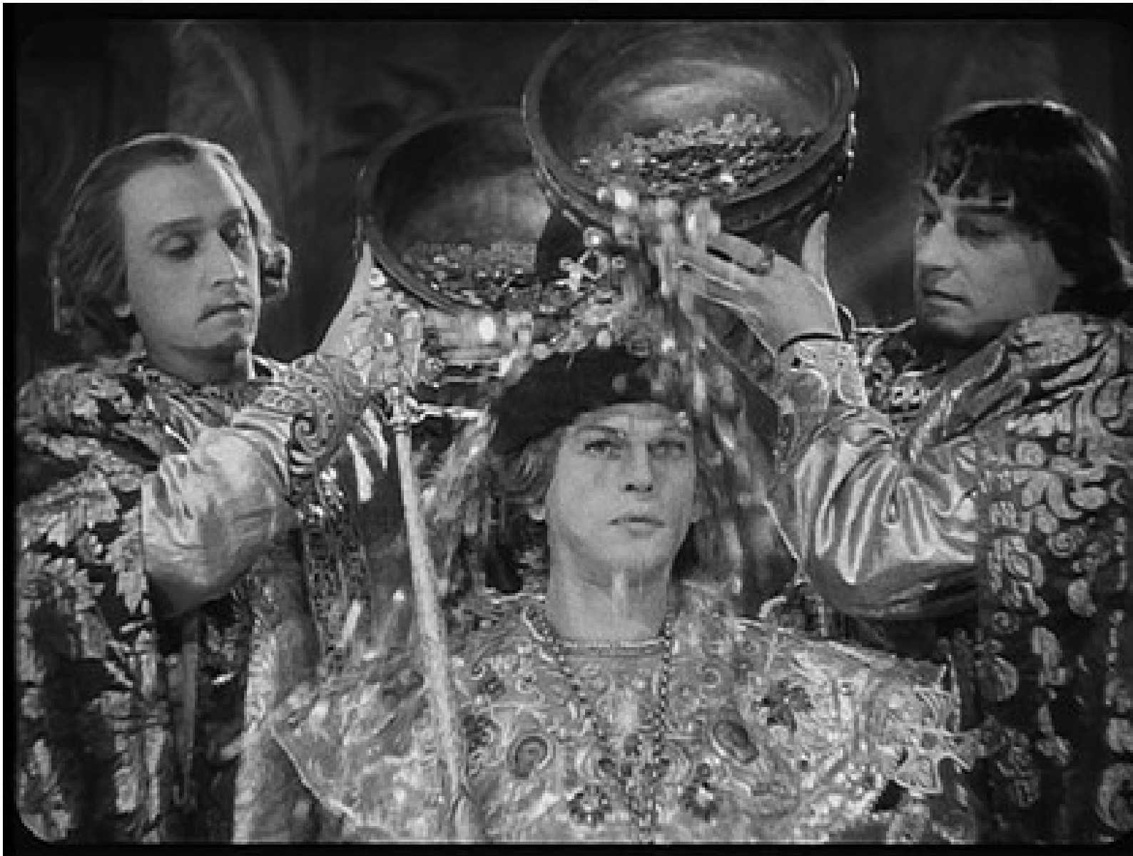
Sergej Ejzenštejn – Ivan Hrozný (1945)