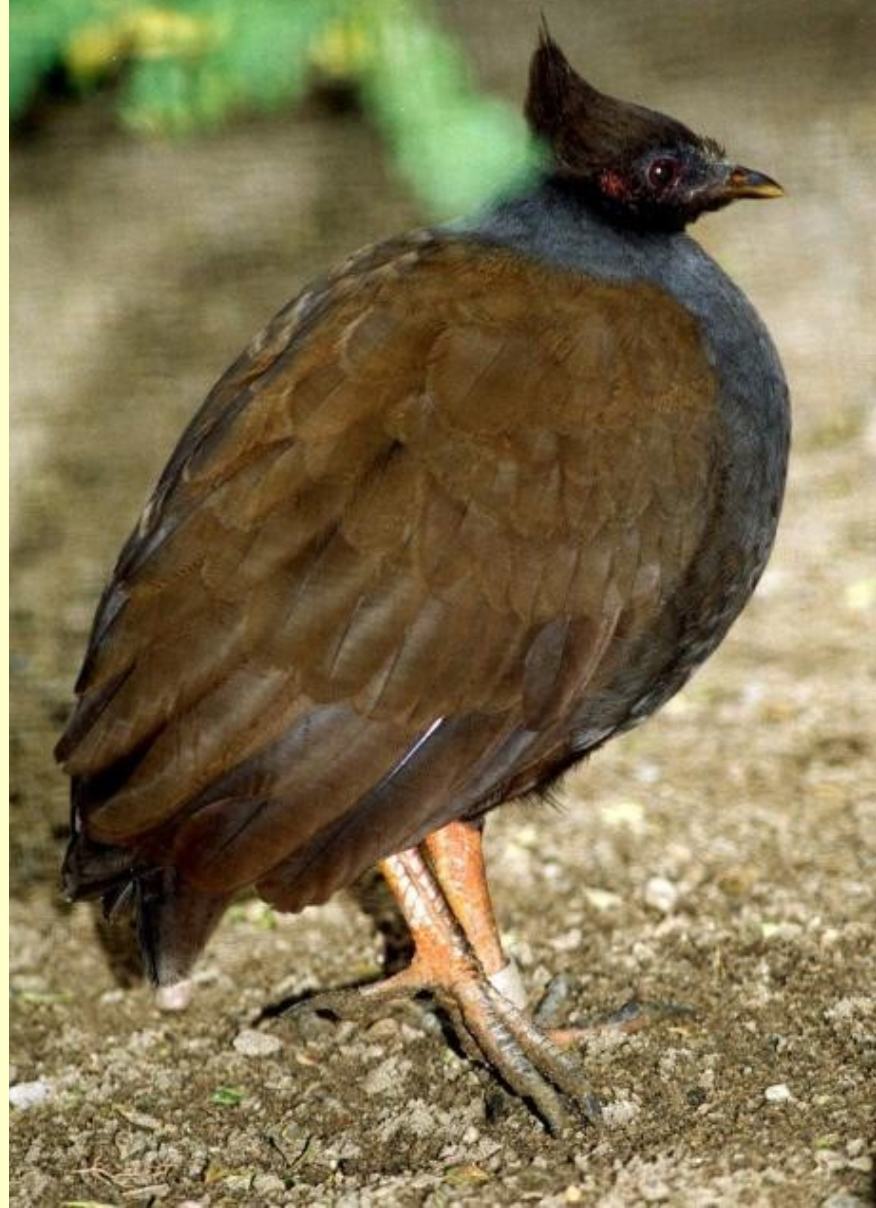
Tabon oranžonohý Megapodius reiwartd