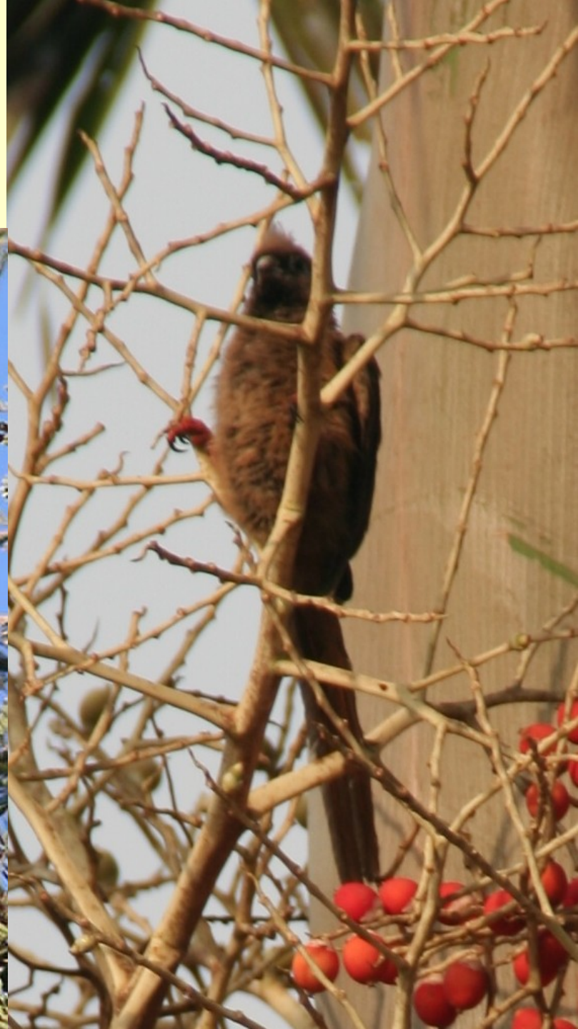
Myšák hnědokřídlý Colius striatus – střední až jižní Afrika