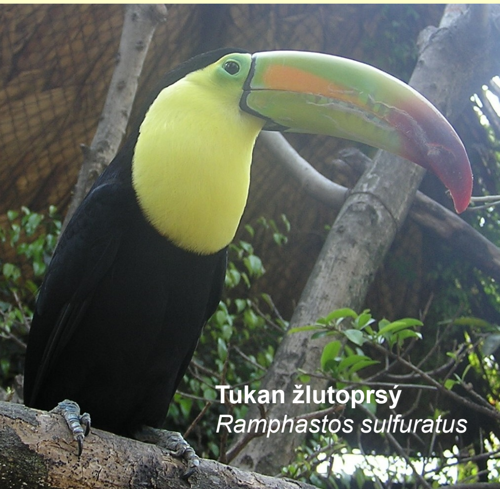
Tukan žlutoprsý Ramphastos sulfuratus

Plodožraví dutinová pralesní ptáci Střední a Jižní Ameriky se zygodaktylní nohou. Zobák jako identifikační znak druhu pomáhá i při šplhu. Dlouhý třásnitý jazyk