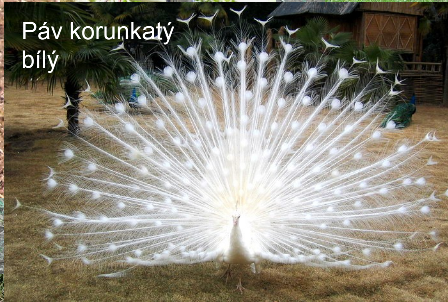
Páv korunkatý bílý