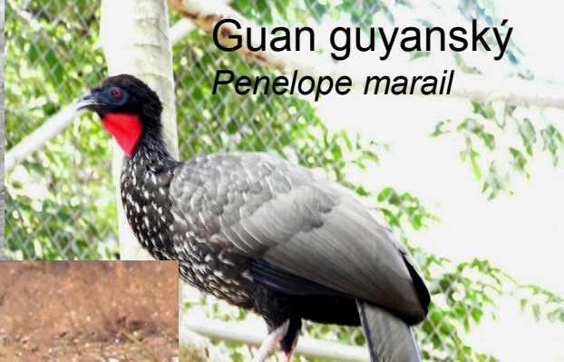
Guan geyanský Penelope marail