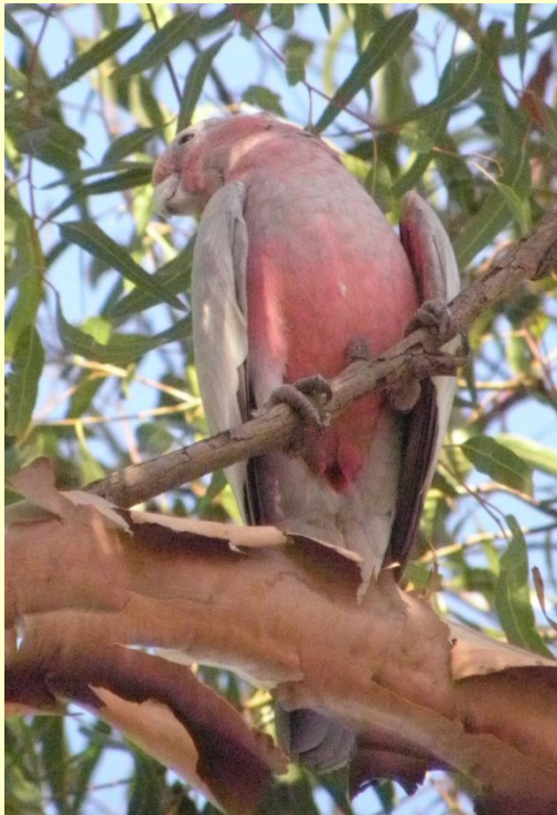
Kakadu růžový Eolophus roseicapillus

stromoví dutinoví ptáci s vyvinutým zobákem. Hákovitá horní čelist je kloubně spojena s mozkovnou. Zygodaktylní šplhavá noha i podává potravu. Nápadný jazyk, velké vole, často chybí kostrční žláza ( drobivý prach ). Vyvinutý koncový mozek. Rostlinná potrava (plody, semena, ořechy, pyl, nektar). Výjimky: nestor kea – maso ovcí (sekundárně).