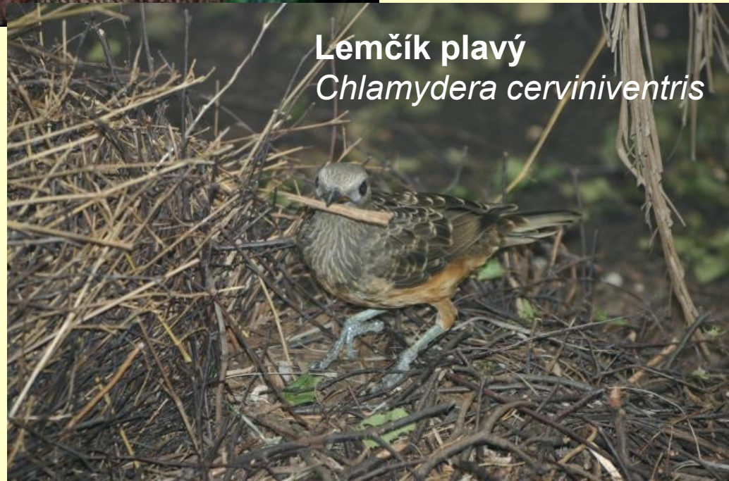
Lemčík plavý Chlamydera cerviniventris