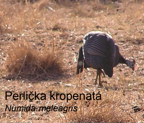
Perlička kropenatá Numida meleagris