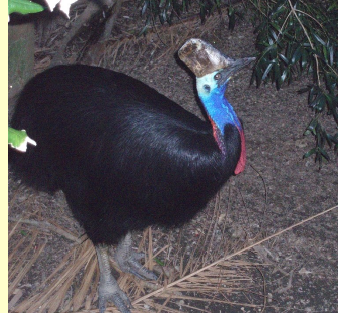
Kasuár přílbový – N. Guinea, Austrálie (deštné lesy)