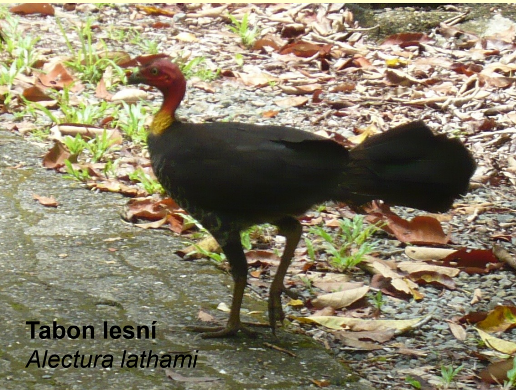
Tabon lesní Alectura lathami

– inkubace vajec v hromadách tlejícího listí (výjimečně v písku u horkých sopečných pramenů nebo sopečném písku). Samci střeží a udržují teplotu v hnízdech. Velká vejce. Vyvinutá mláďata bez rodičovské péče. Lesy a křovinaté oblasti Austrálie, Nové Guineje, Indonésie.