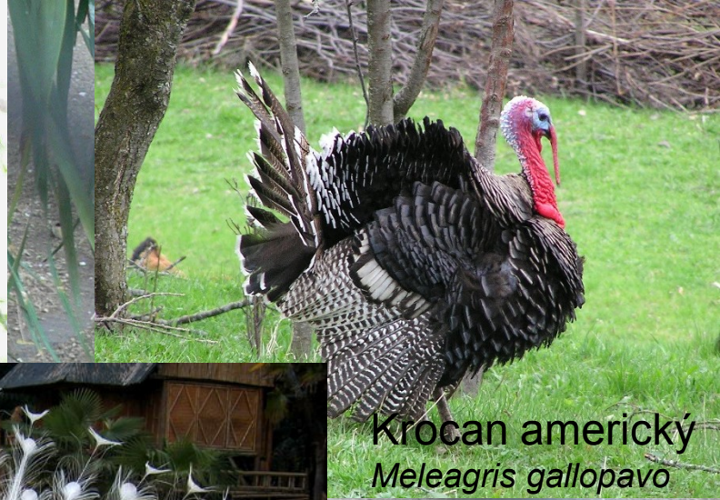
Krocan americký Meleagris gallopavo