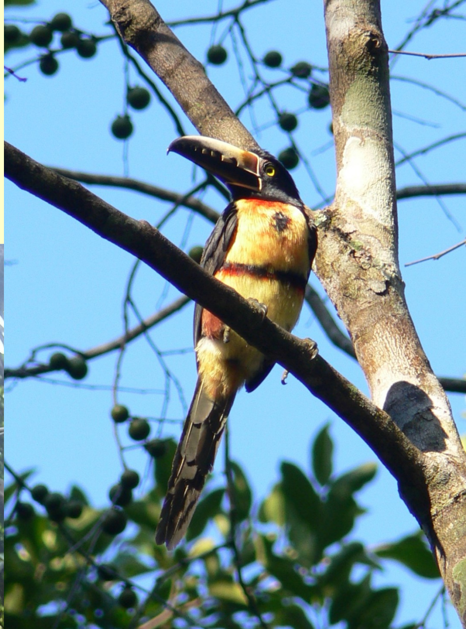
Arasari obojkový Pteroglossus torquatus