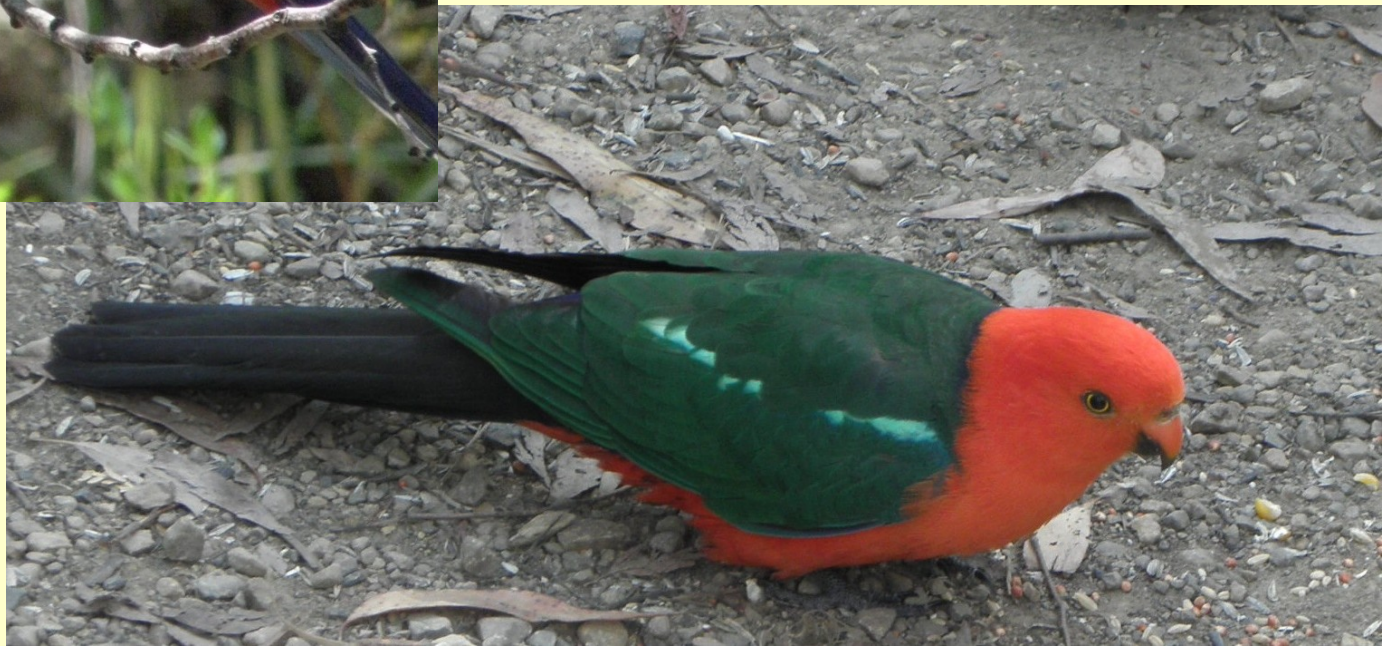
Papoušek královský Alisaterus scapularis