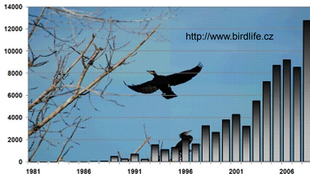
Počet zjištěných kormoránů v České republice

Během zimního období k nám pak zavítalo 10 000 – 15 000 ptáků ze severských zemí.