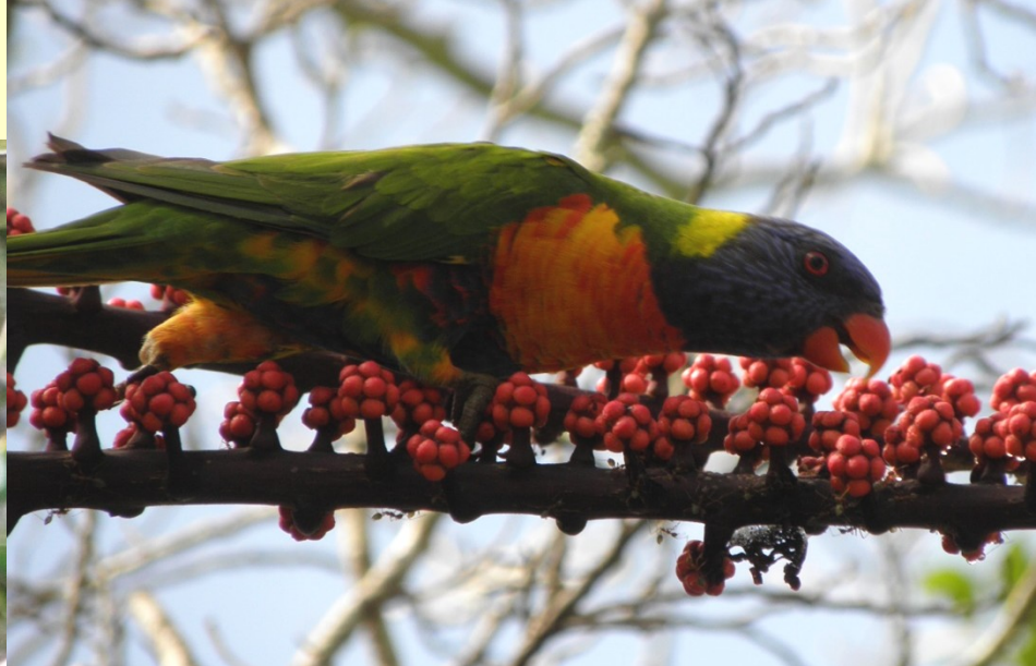
Lori mnohobarvý Trichoglossus haematodus