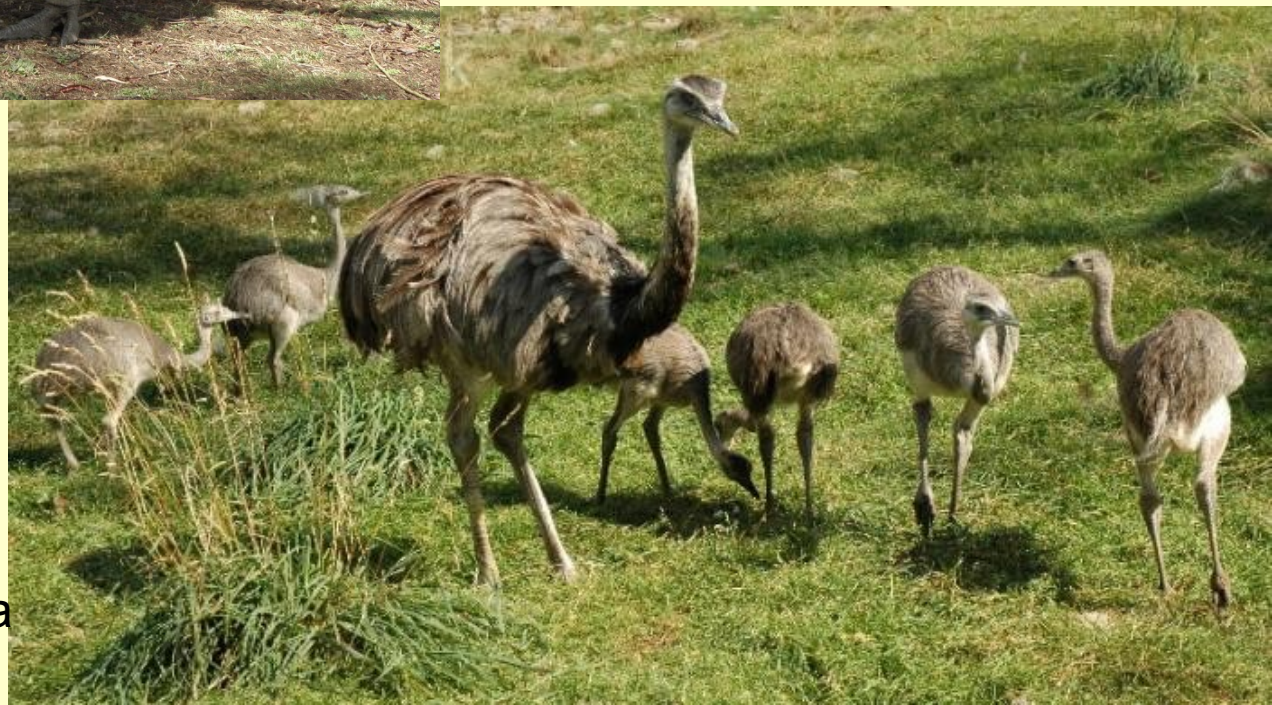
Nandu pampový – J.Amerika

Řád: PŠTROSI ( nanduové, kasuáři ) nelétaví běžci z rozdílných kontinentů