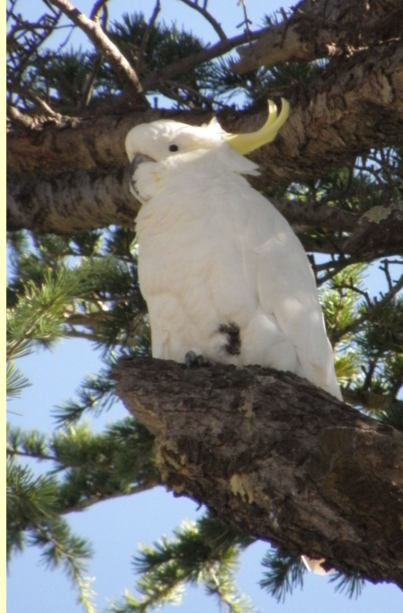
Kakadu žlutočelatý Cacatua galerita – stromové porosty Austrálie

P. mniší si jediný staví kulovitá hnízda