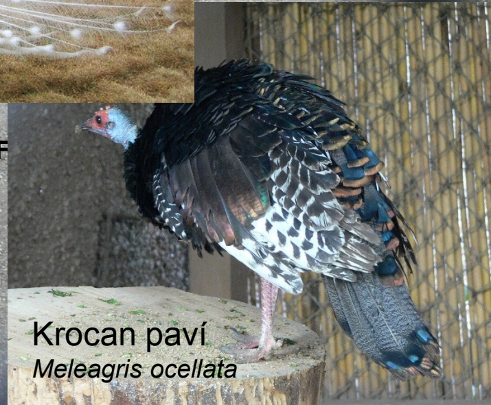
Krocan paví Meleagris ocellata