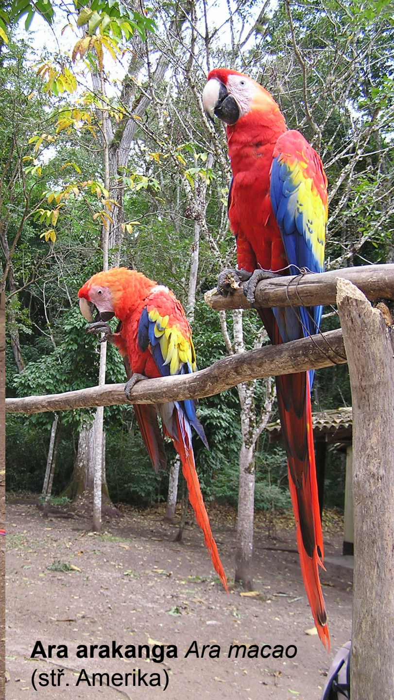
Ara arakanga Ara macao (stř. Amerika)