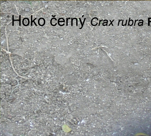
Hoko černý Crax rubra F