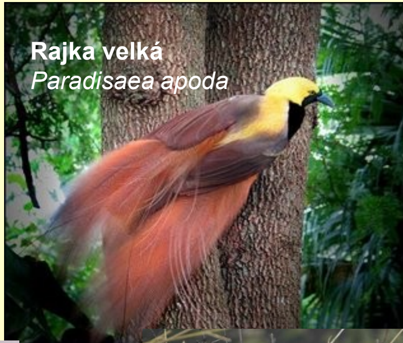
Rajka velká Paradisaea apoda

– M s nápadným zbarvením a nadměrně vyvinutými pery. Nenápadné F volí nejzdatnějšího samce, o mláďata pečují samy. Nápadný skupinový tok. Centrum rozšíření: Nová Guinea.