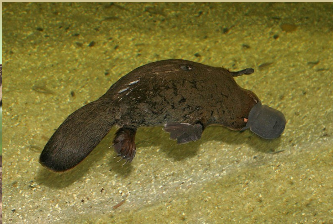
Ptakopysk (podivný)