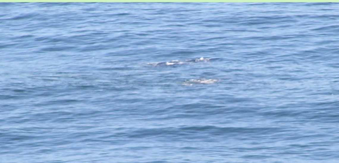
Whalewatching – velryba jižní

Ozubení – homodontní (další redukce), 1 nosní otvor, čelisti stejně dlouhé