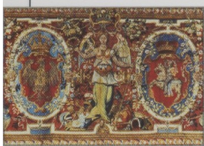
▲ Arras z herbami Korony i Litwy ze zbiorów na Wawelu symbolizuje jedność państwa polsko-litewskiego, zwanego od czasów unii lubelskiej Rzeczpospolitą Obojga Narodów.