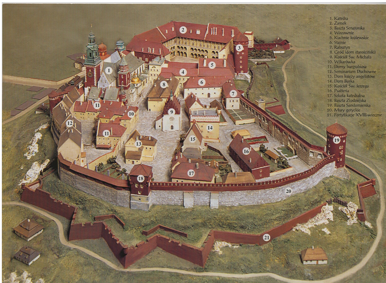
Obr. 1 KRAKOW – WAWEL – renesanční zámek + katedrála sv. Stanislava s hroby polských králů

K nejprůkopnějším dílům renesanční urbanistiky náleží Zamošć . (dnes památka UNESCO)