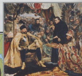
▶ Król Stefan Batory pod Pskowem. Jego kampania w Inflantach (1579-82) przeciw wojskom cara Iwana IV Groźnego zakończyła się pełnym sukcesem. (Obraz Jana Matejki).