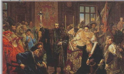
◀ Unia lubelska z 1569 roku zmieniła unie polsko-litewską z personalnej (gdzie oba państwa byłyby jedynie