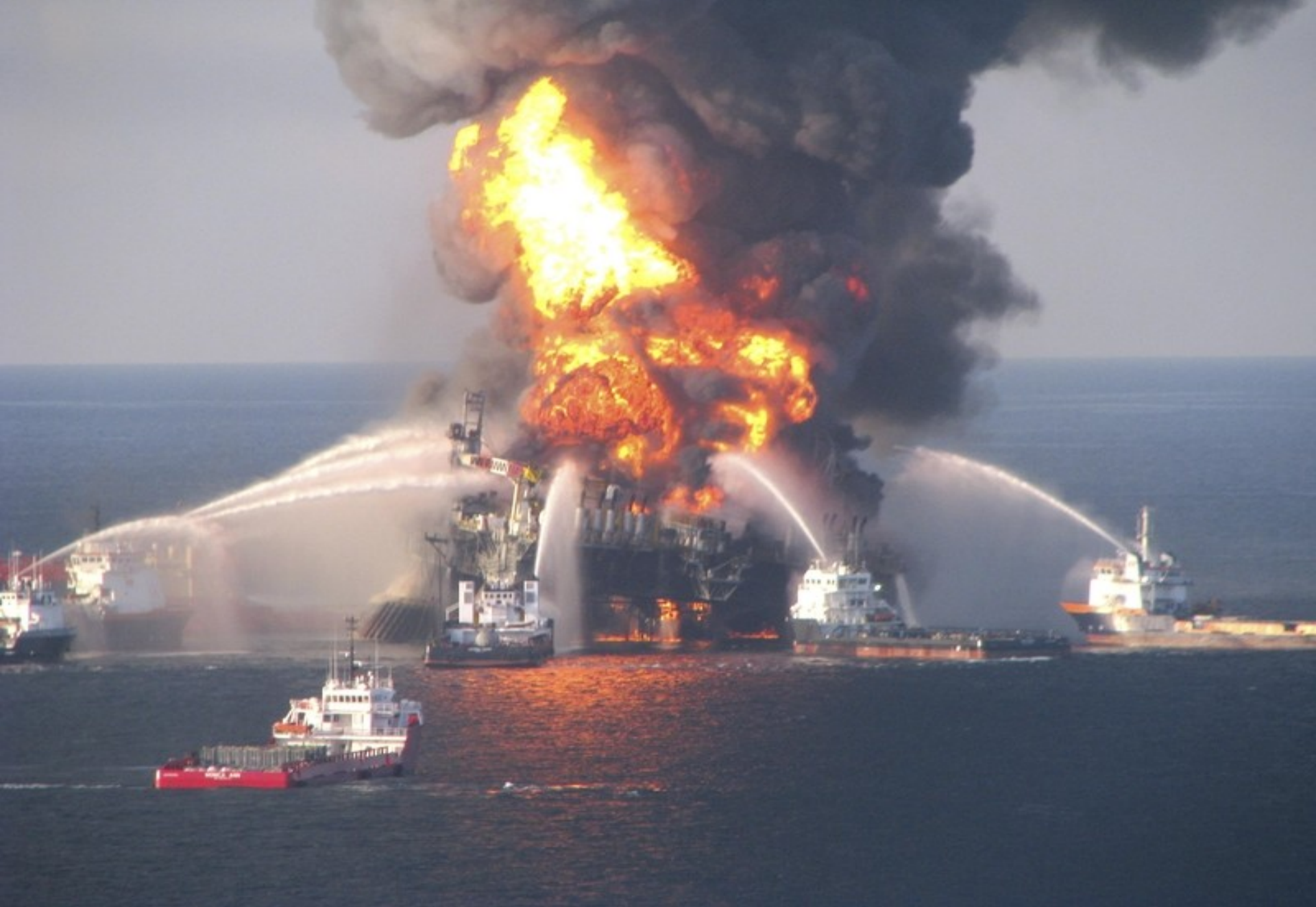
Obr. 2.: Požár těžební ropné plošiny na moři.