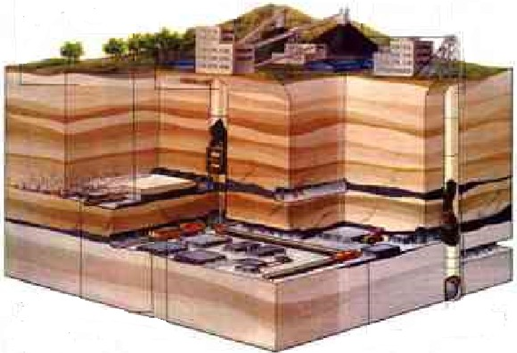
Obr. 3.: Těžba černého uhlí pod povrchem.