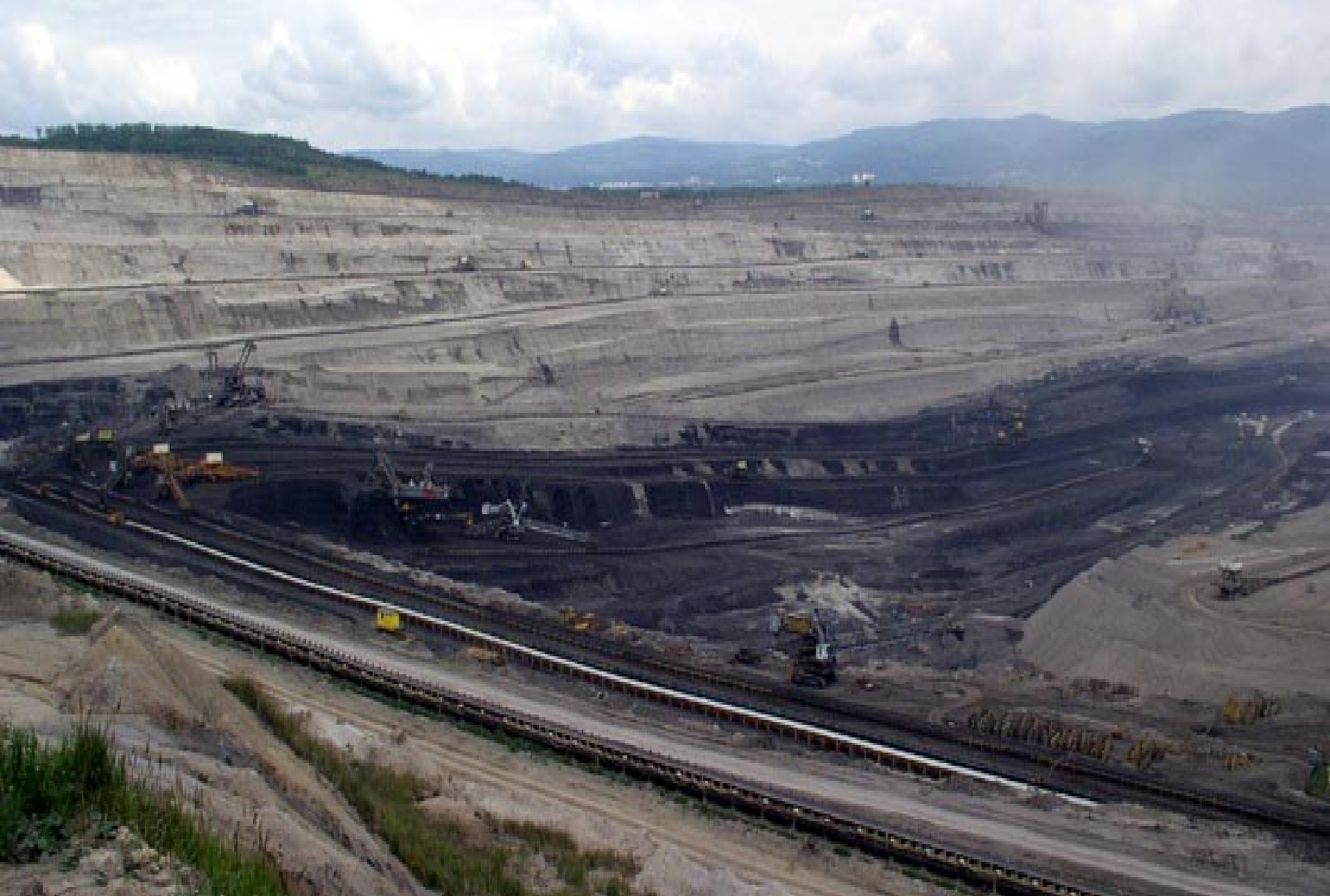
Obr. 4.: Povrchová těžba hnědého uhlí.