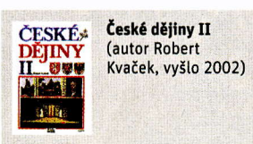
České dějiny II (autor Robert Kvaček, vyšlo 2002)

Souhlas (Československa) s dohodou pokládali (zástupci mocností) za samozřejmý.