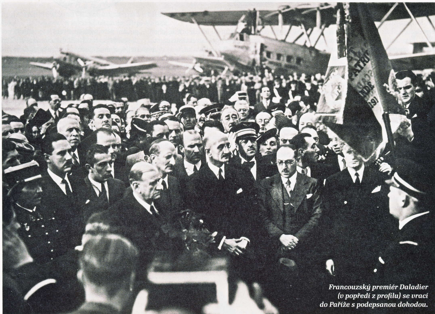
Francouzský premiér Daladier (v popředí z profilu) se vrací do Paříže s podepsanou dohodou.

Názor na historické události si většina lidí tvoří ze středoškolských učebnic. Co se v nich píše o mnichovské dohodě, události, kterou Češi považují za jednu z nejdůležitějších ve svých dějinách? Nahlédli jsme do učebnic ve Francii, Velké Británii a Německu, tedy zemích, jež mnichovskou dohodu o tehdejší Československu podepsaly.