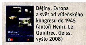
Dějiny. Evropa a svět od vídeňského kongresu do 1945 (autoři Henri, Le Quintrec, Geiss, vyšlo 2008)

Německo-francouzská středoškolská učebnice se v praxi používá jen málo, je nicméně zajímavá tím, že se na jejím textu museli shodnout francouzští a němečtí historikové.