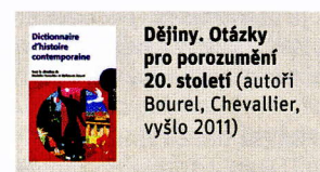
Dějiny. Otázky pro porozumění 20. století (autoři Bourel, Chevallier, vyšlo 2011)

Německo postupně porušovalo klauzule Versailleské smlouvy a rozšiřovalo své území v srdci Evropy. Po militarizaci Porýní následovalo připojení (Anšlus) Rakouska k Německu v březnu 1938, odvodněný plebiscitem. V září 1938 Hitler požaduje připojení německých částí Československa: Sudety.