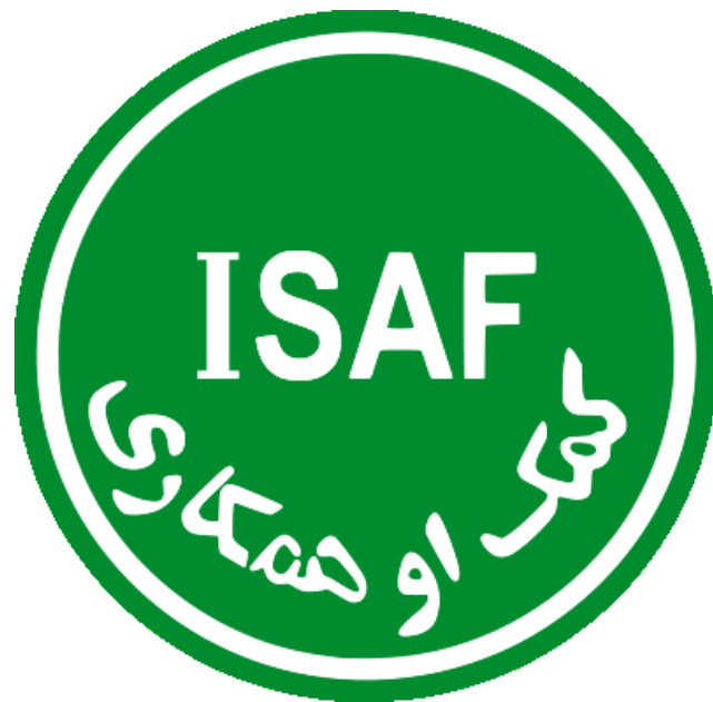
Logo International Security Assistance Force (mezinárodní bezpečnostní podpůrná síla (pomoc a spolupráce))