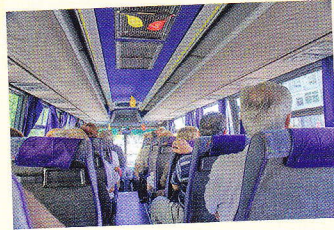
обозреватёльная поёздка okružní (vyhlídková) jízda