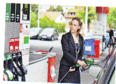
заправка (hovor.) čerpací stanice