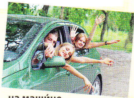
на машине autem