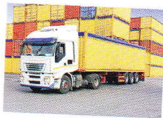
грузовик nákladní auto