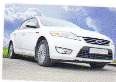
легковушка (hovor.) osobní auto