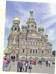
храм Васíлия Блажённого в Москвё Chrám Sv. Vasilá Blaženého v Moskvé

Экскурсионный туризм – это поёздки, путешёствия, походы с цёлью посещения каких-либо мёстностей и ознакомления с памятниками природы и достопримечательностями. Единичная экскурсия, как правило, занимает не бóлее одного дня. Ёсли же подразумевается ряд экскурсий в течение нёскольких дней или недель, то это мóжно назвать экскурсионным туром. Для того, чтобы поближе познакомиться с каким-нибудь одним гóродом, узнать о его истории, культурных и бытовых особенностях, надо совершить экскурсионно-обозреватёльную поёздку. Экскурсионные туры обычно включают в себя посещение нёскольких гóродов или стран с экскурсионной программой, авиаперелётами, железнодорожными и автобусными переездами.