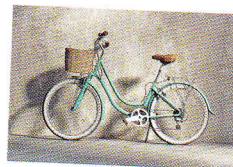
велосипед jízdní kolo