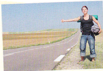
автостоп autostop, stopování