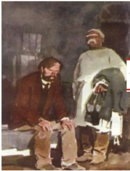
«ПАЛАТА № 6»

о том, как жили душевнобольные в больнице.