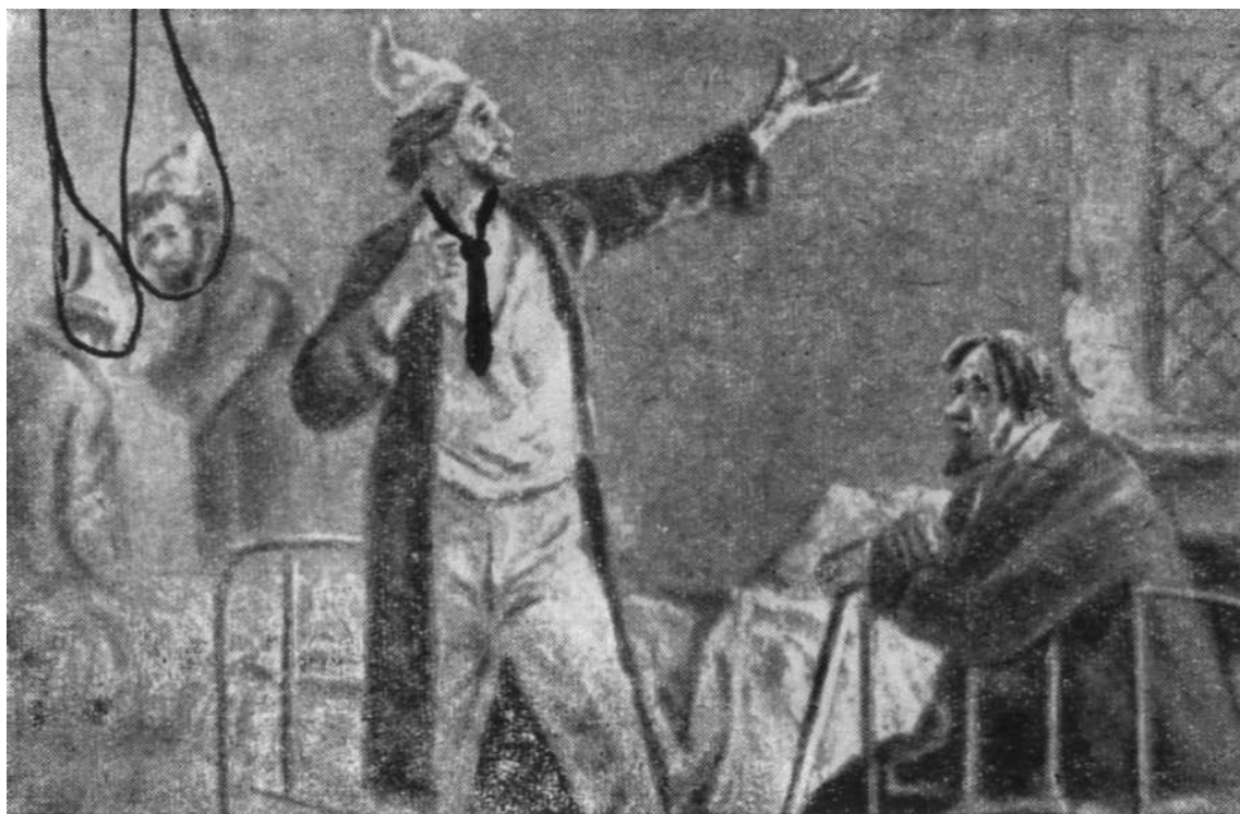
А. Ванециан. «Палата № 6». Разговор Рагина с Громовым

Это уже не маленькие юмористические рассказы, а произведения со сложным анализом жизни его современников.