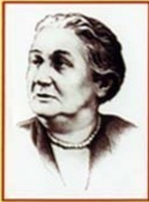
АХМАТОВА Анна Андреевна (1889-1966)