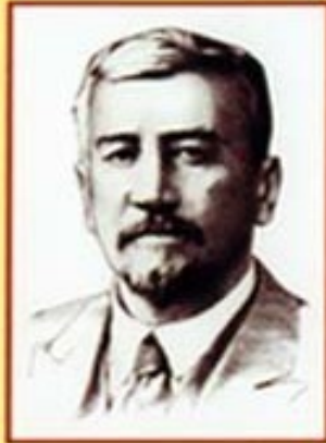
КУПРИН Александр Иванович (1870-1938)