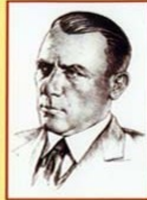
БУЛГАКОВ Михаил Афанасьевич (1891-1940)