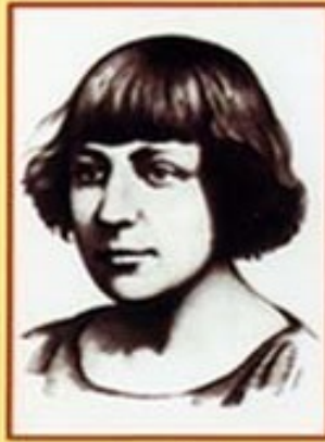
ЦВЕТАЕВА Марина Ивановна (1892-1941)