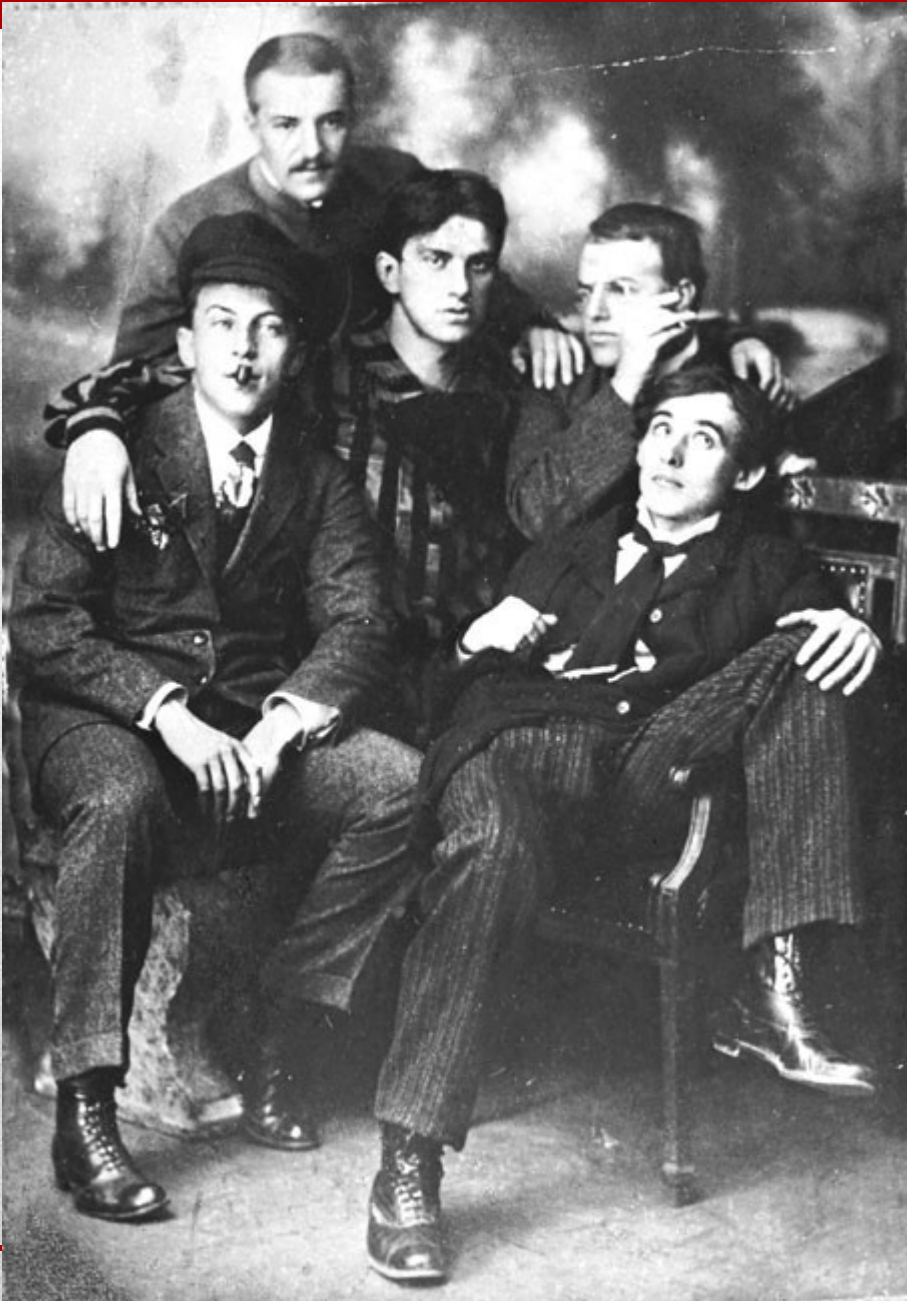
Фотография, напечатанная в «Пощёчине общественному вкусу». Справа налево: А. Кручёных, Д. Бурлюк, В. Маяковский, Н. Бурлюк, Б. Лившиц