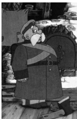
Картинка № 2