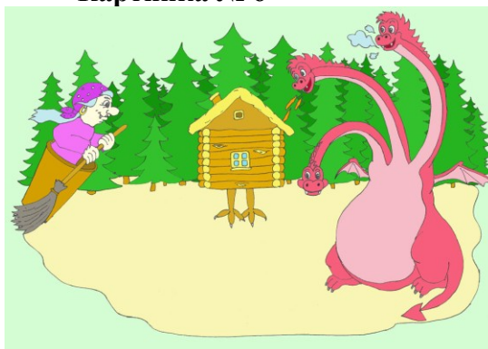
Картинка № 8