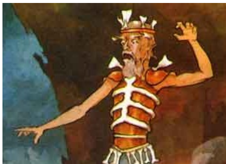
Картинка № 6