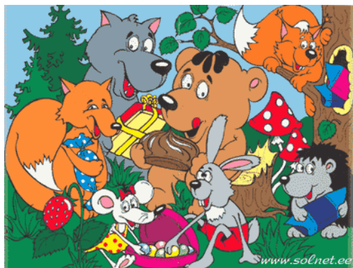
Картинка № 7