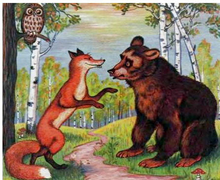
Картинка № 4