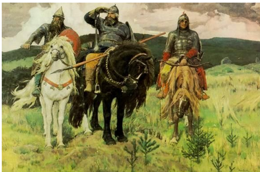
В. Васнецов «Богатыри»

Илья что? рассказывает о чём? что? называется как?