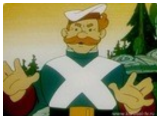
Картинка № 5