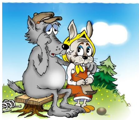
Картинка № 1