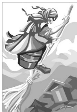
Картинка № 3