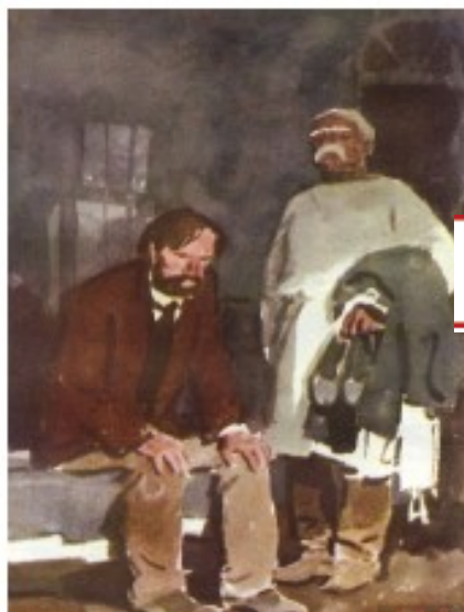
«ПАЛАТА № 6»

о том, как жили душевнобольные в больнице.