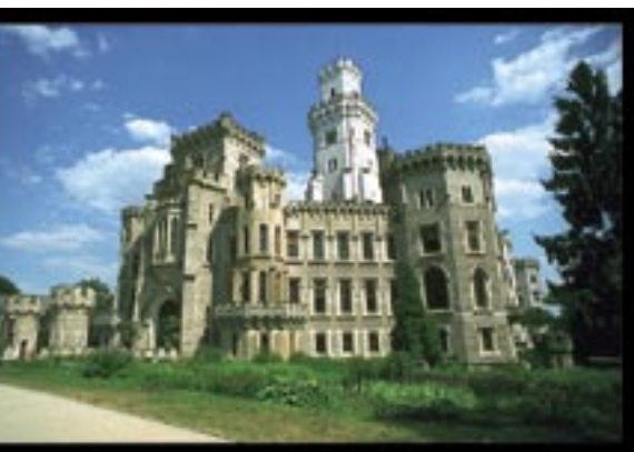
obr. 1a Normální vidění