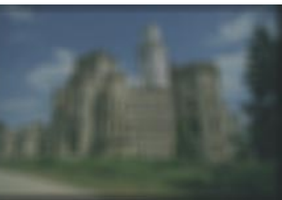
obr. 1b Těžká vada refrakce