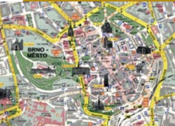
obr. 3a Normální vidění