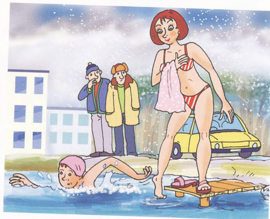
зимнее купание zimní koupání

Чтобы не болеть, надо закаляться. Закáливание – это тренировка защитных сил организма. Для закалывания используют естественные факторы природы – воздух, воду, солнце. Главная профилактическая роль закалывания – предупреждение болезней. Закалённый человек легко переносит не только жару и холод, но и резкие перемены внешней температуры, которые способны ослабить защитные силы организма. Он менее восприимчив к различным заболеваниям: гриппу, катару верхних дыхательных путей, пневмониям.