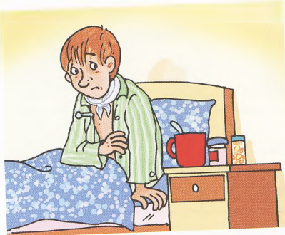
Витя болéет. Vítá stůně.

Когдá человек заболéет, он чóвствует себя плóхо. У него болíт головá, гóрло или живóт. У него высóкая темперáтура и нáсморг. Ему нáдо идтí к врачó. Врач осмóтит его и выпишет рецéпт.