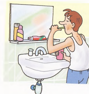
личная гигиена osobní hygiena

Здоровый образ жизни – это правильное питание, движение, полноценный сон, личная гигиена и отсутствие вредных привычек, таких как курение, употребление спиртных напитков и наркотиков.