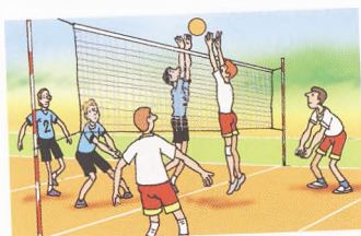
заниматься спортом sportovat