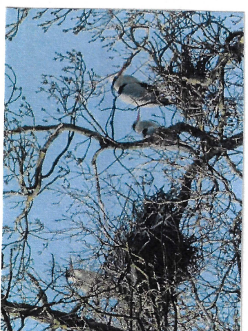
hnízda čapů a volavek