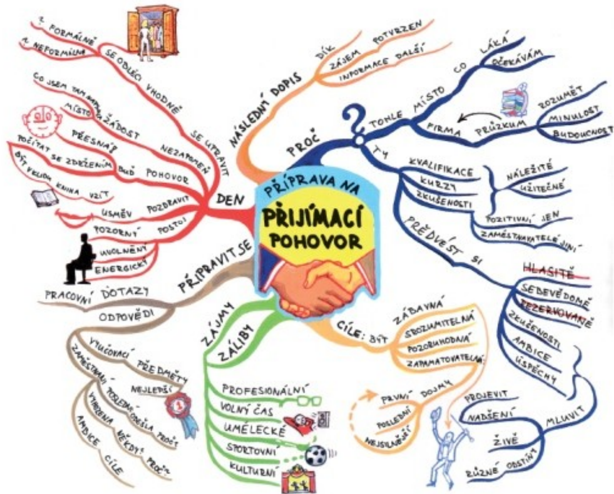
Obr. - Příklad mentální mapy přijímacího pohovoru