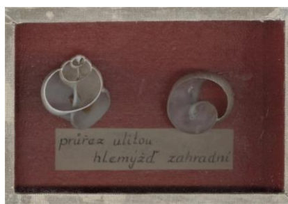
Obr. 3: Řezy ulitami hlemýždě (sloupek a jeho dutost)

Okomentoval(a): [RV1]: Téma samostatné distanční praktické výuky