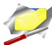
125 g beurre