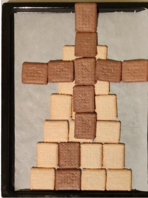
Martin – interpretace – tohle není abstrakce