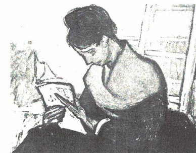
Leser verschiedener Epochen haben einen anderen Zugang zum selben Text; Vincent van Gogh: Die Romanleserin (1888)

Die moderne Rezeptionsästhetik beschäftigt sich seit dem Ende der 1960er-Jahre bevorzugt mit Fragen, die die Wahrnehmung des Lesers beeinflussen, beispielsweise mit seinen Interessen, seiner Bildung und dem sozialen Umfeld, in dem er steht. Der Rezipient hat also durch seinen Verstehenshorizont Anteil an der Aussage des Textes . Entscheidend ist daher die Frage nach der Reaktion des Lesers: Findet bei ihm eine Erweiterung seines geistigen Horizonts statt? Oder ist sein Blickfeld so eingeschränkt , dass er die Tiefe der Textinformationen nicht erkennt bzw. diese völlig missversteht?