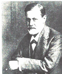
Sigmund Freud im Jahr 1909

Die Vertreter dieser Richtung berufen sich auf Sigmund Freud (1856–1939), den Begründer der Psychoanalyse. Nach ihnen lassen sich Stoff- und Motivwahl, Figurengestaltung und sprachliche Bilder auf verdrängte Triebe, Wünsche und seelische Verletzungen des Autors zurückführen. Die psychoanalytische Methode, die besonders in den 1960er- und 70er-Jahren verbreitet war, beschränkt sich aber nicht nur auf den Autor, sondern untersucht auch die handlungsauslösenden Kräfte und Verhaltensweisen der Figuren sowie mögliche Auswirkungen auf (unbewusste) Leserreaktionen. Das Verfahren bedeutet eine Abkehr von überzogenen idealistischen Vorstellungen. Allerdings lassen die enge Fixierung auf Psychisches und das Ausklammern des historisch-sozialen Umfelds unkritische Spekulationen befürchten. Außerdem besteht bei Anwendung dieser Methode die Gefahr, das Künstlerische des Werkes zu vernachlässigen .