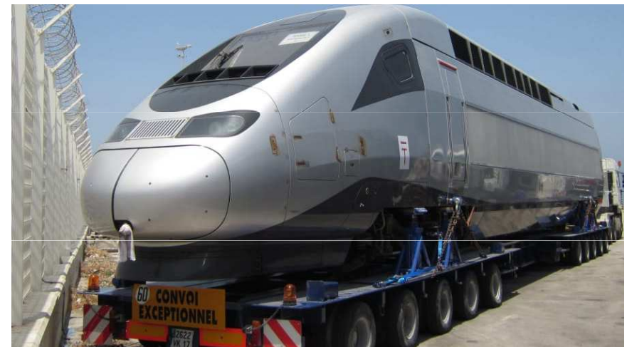
Obrázok 08: prvý africký rýchlovlak (Maroko), 2018