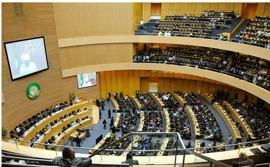
Obrázok 04: rokovanie Zhromaždenia hláv štátov AÚ