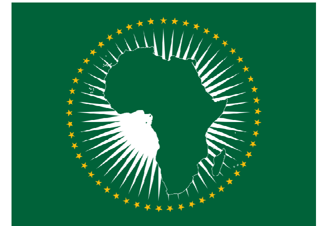
Obrázok 02: vlajka AÚ