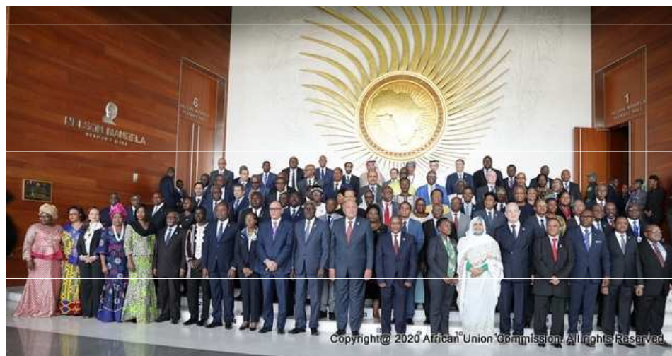
Obrázok 05: výkonný výbor