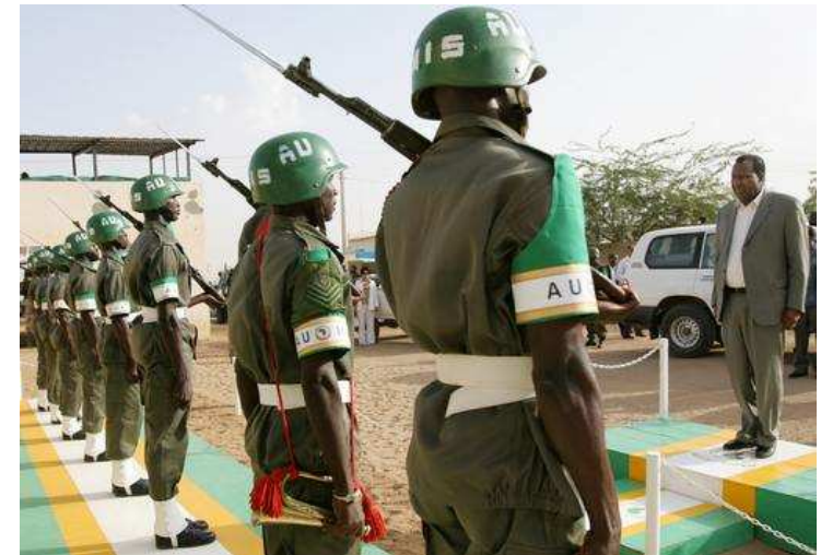
Obrázok 06: Africké pohotovostné sily