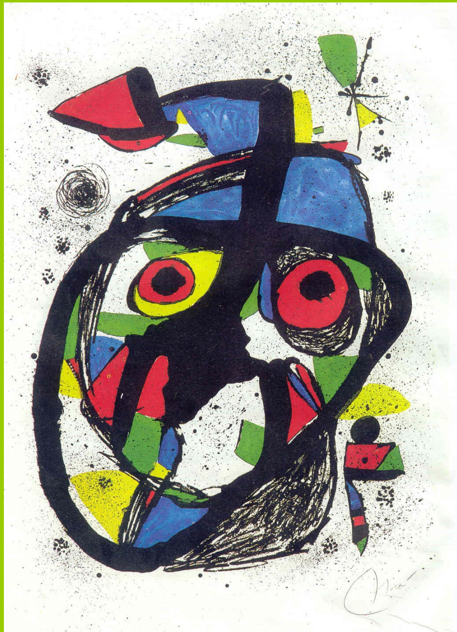
Jean Miró (Španělský - Katalánský umělec)